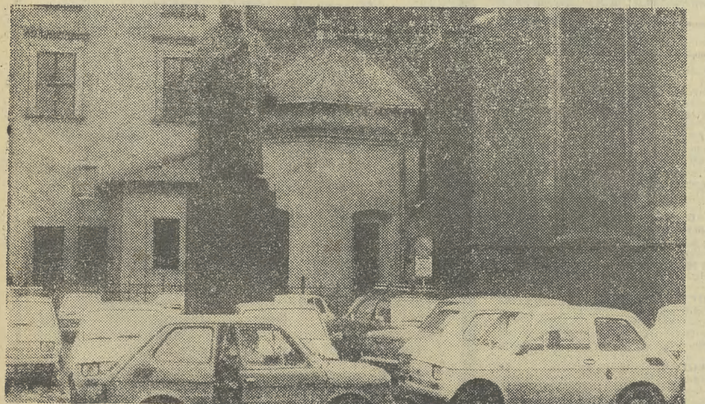
„Obłeczenie” prezydenta Dietla

DZIŚ O GODZINIE: * 17 — Klub Seniora ZDK HIL, os. Na Skarpie 64 — Biesiada wigilijna. * 17.30 — Klub Kombatanta ZBoWiD, os. Góralski 23 — Przedświąteczne spotkanie kombatantów przy wspólnym stole. JUTRO O GODZINIE: * 16 — Sukienice „Kram pod Praskami” — Występ zespołów kołodniczych. * 19 — Klub „STARÓWKA”, ul. Szczepańska 5, II p. — mgr E. Jakóbek — „Co nowego w kraju i świecie?”.