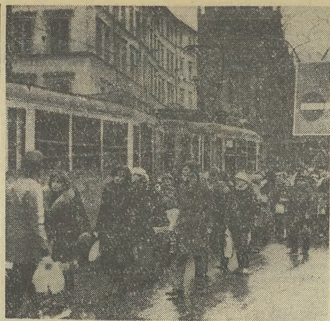
Godzina 15...

Chcesz mieć święty spokój i przynajmniej w okresie świątecznym choć trochę odpocząć? — kup swej Szanownej Magnifice Średnio-wieczną historię naturalną Józia Fostafińskiego!