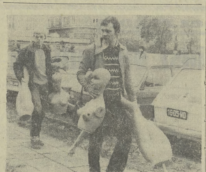
Czego to ludzie nie noszą!