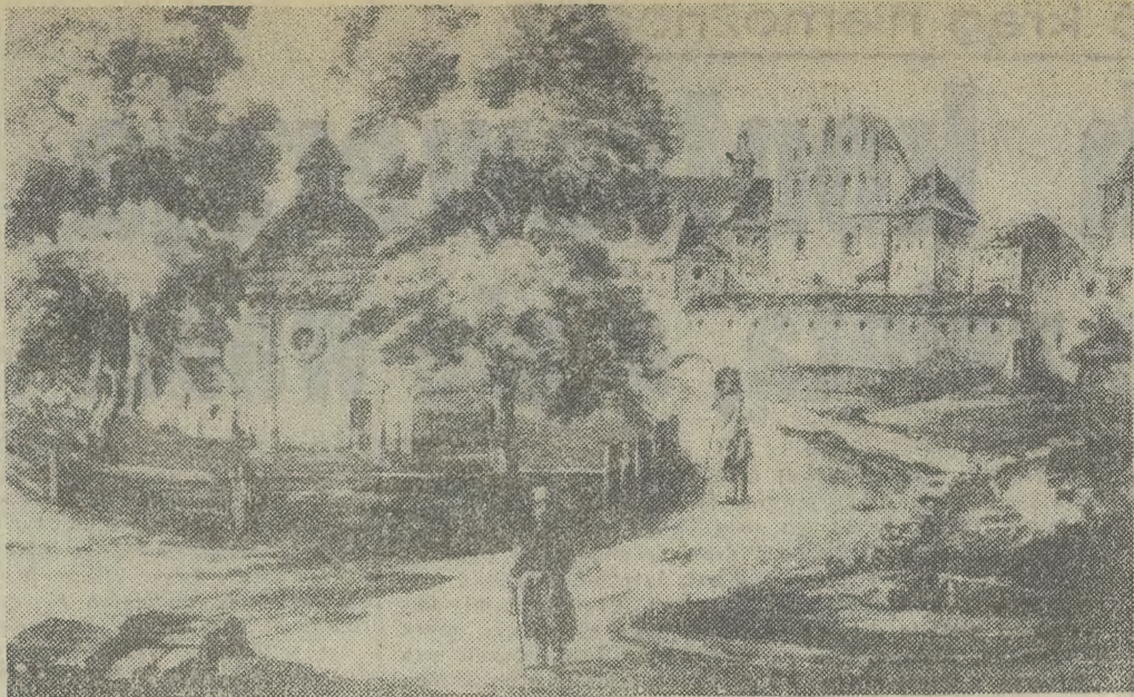
Kościół św. Gertrudy