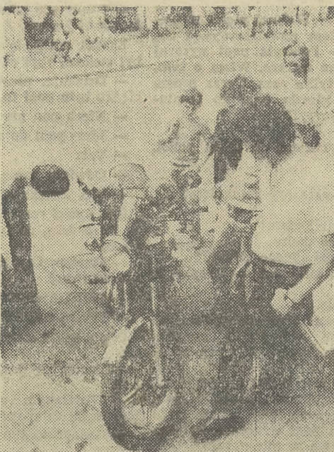
Honda — motocykl dla chłopięc...

Choć mały sklep legitymuje się sporym obrotem — 1200 tys. złotych miesięcznie. Obok płyt oferuje największy wybór kaset w Krakowie, a także podstawki pod płyty i kasety. Zapytani o najlepiej ostatnio sprzedawane powoje państwo Placiek wymieniają „Best of Niemen”, „Welcome” zespołu SEB, płytę Żanny Biczewskiej i mały kraczek zespołu Pink Floyd. (JK)