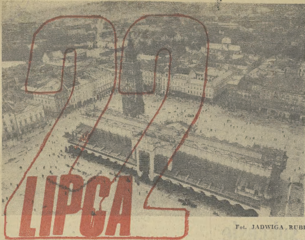
Fot. JADWIGA RUBIŚ