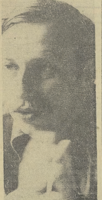
Jerzy STUHR — aktor: — Ja nie lubię pojęcia praca, zawód. Dla mnie jest to po pro- stu model życia, mój model...

NIE DARMO POSELUŻY- LAM SIĘ w tym mie- scu tak obszernym cya- tem. Pochodzi on bo- wiem z wydanego przez Wydawnictwo Literackie w Krakowie zbioru esejów za- tytułowanego: „Polaków portret własny” — zbioru zainspirowa- nego wystawą o tym właśnie tytuł. Wystawa, która jak wia- domo stała się prawdziwym wydarzeniem w życiu kultural- nym Krakowa i która odbija się szerokim echem w całym kraju.