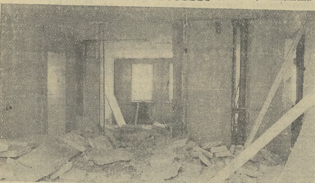
To tylko fragment totalnego zniszczenia i przeróbek w parterze bloku mieszkalnego przy ul. Serbskiej 1, przeznaczonym na przedszkole. Identycznie było przy innych adaptacjach.