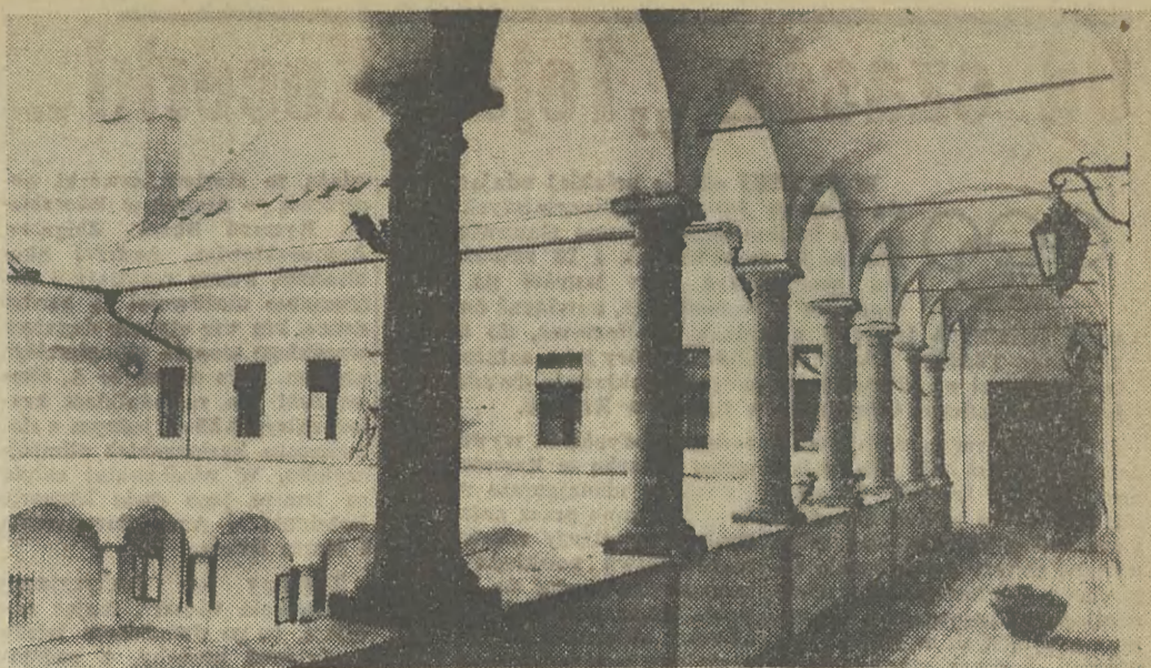
Niezmierna jest uroda krakowskich dziedzińców - oto spojrzania na Collegium Nowodworskiego, gdzie ma swą siedzibę Akademia Medyczna w Krakowie.

Na dziedzińcu Śródmiejskiego Ośrodka Kultury, ul. Mikołajska 2 do 14 bm., codziennie o godz. 21 koncertuje kwartet smyczkowy „Wawelskie Smyczki”. Bilety do nabycia na miejscu.