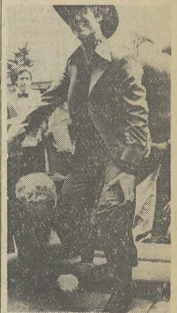
John Travolta, znany polskim widzom z filmu „Gorączka sobotniej nocy”, jest 161. aktorem, którego odciski dłoni, buta oraz autograf uwiecznione zostały w betonie w tym jednym swego rodzaju „muzeum” hollywoodzkim.

Ekipy ratunkowe odnalazły w niedzielę zwłoki nielegalnych imigrantów z Salwadoru, porzuconych w sobotę na pustyni w Arizonie po zrabowaniu im przez przewodników wszystkich pieniędzy. Bilans tragedii obejmuje 23 ofiary śmiertelne. Kilkunastu osobom, znalezionym w stanie skrajnego wycieńczenia, nie zagraża już niebezpieczeństwo. Nadal kontynuuje się poszukiwania przy użyciu patroli konnych oraz śmigłowców i samolotów. Uratowani zawiadują życie jednej z kobiet, która po dotarciu do szosy, zatrzymała kierowcę, który zaalarmował władze o tragedii, największej od podobnego wypadku porzucenia imigrantów latynoskich przez przewodników przed 3 laty.