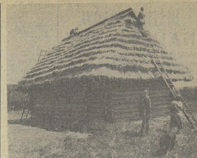
Wojewódzki Park Kultury i Wypoczynku w Chorzowie (woj. katowickie) będzie miał kolejną atrakcję — skansen. Zgromadzone już 30 obiektów mieszkalnych, gospodarczych i warsztatów rzemieślniczych z obszaru Beskidów aż po tereny lublinieckie. Najnowszym nabytkiem jest dziewiętnastowieczna chałupa z Dzieckowic. Na zdjęciu widać prace remontowe przy tej właśnie chałupie.