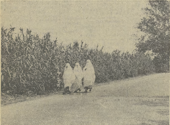
Algieria. 90 proc. ludności koncentruje się na północy kraju. Rejony pustynne są niemal bezludne, a prawie wszyscy mieszkańcy skupieni są w oazach. Na zdjęciu: kobiety arabskie w drodze na targ.

Innym rozwiązaniem będzie sztuczne wzbogacanie atmosfery w tlen. Ogromne zasoby tego pierwiastka znajdują się w oceanach. Woda składa się w 86 proc. z tlenu, który można uwolnić za pomocą elektrolizy. Chemicy znają wiele skał i minerałów tworzących skorupę ziemską umożliwi także uzyskiwanie dużych ilości tlenu. Jednak metody te nie są opłacalne, wymagają zbyt wielkich nakładów energii. Najbardziej opłacalne są — jak twierdzą klimatolodzy — wszelkie działania, zmierzające do ochrony roślinności wytwarzającej ogromne ilości tlenu.