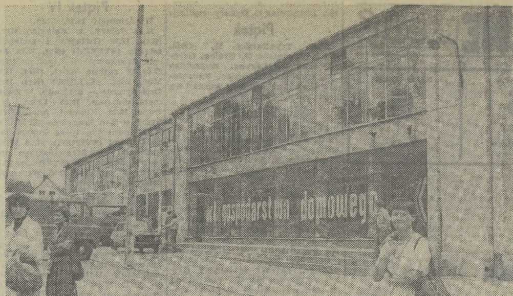
To centrum handlowe już od 2 lat służy gminie Brzesko Nowe i 14 jej sołectwom.