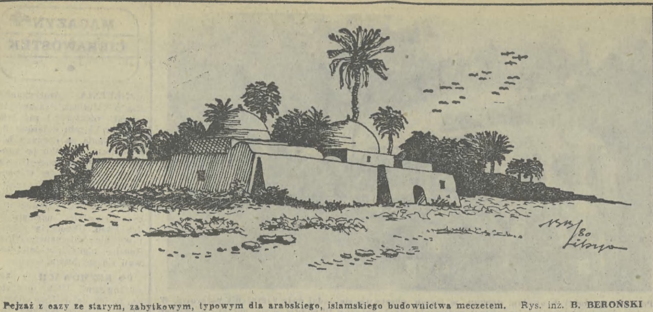
Pejzaż z oazy ze starym, zabytkowym, typowym dla arabskiego, islamskiego budownictwa meczetem. Rys. inż. B. BERONSKI