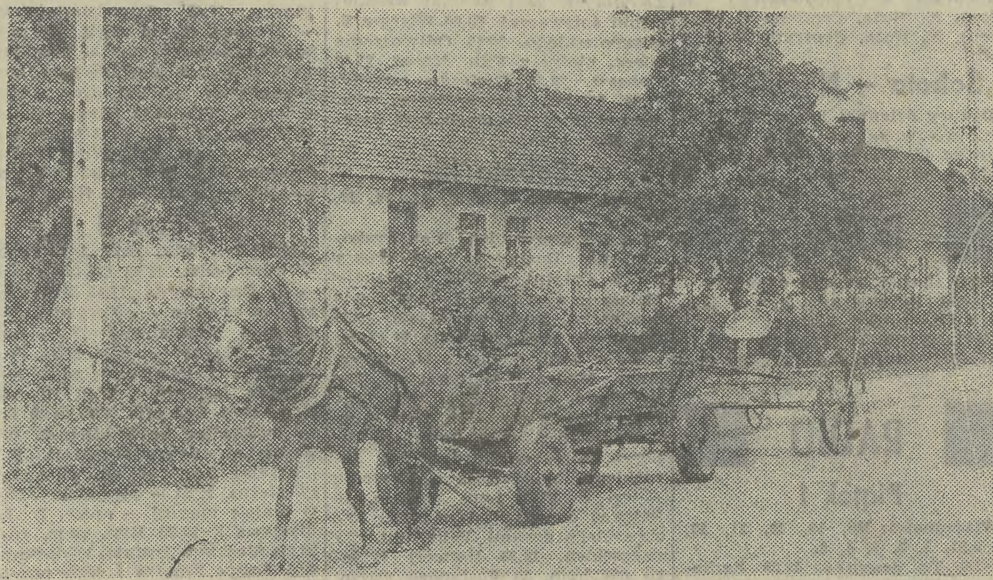
Urok starego Brzeska, jeszcze w XIX w. zwanego Słomianym.

W programie na lata 1981—82 znajdują się również: adaptacja jednego z budynków na b. potrzebny tu wiejski dom kultury, rozbudowa zbiorczej szkoły gminnej wraz z budową sali gimnastycznej i krytej pływalni, budowa spółdzielczej kolonii 20 jednorodzinnych domów. Ma gmina, wykonane przy wielkim współudziale mieszkańców, dobre drogi, pozostało jeszcze tylko uzupełnienie budowy dróg dojazdowych do pól. (bp)