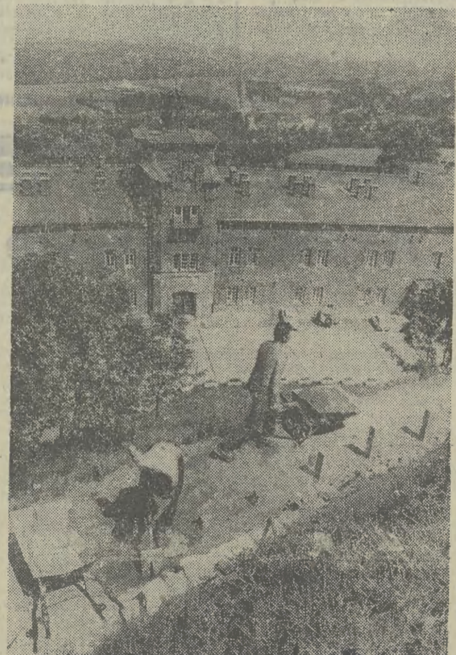
Żołnierze pracują przy restauracji kopca Kościuszki.

Prognozowanie zmian wiecznej zmarzliny ma duże znaczenie praktyczne m. in. dla tamtejszego budownictwa. Głębsze rozmarzanie gruntu, na którym umieszczone fundamenty budynku może spowodować osiadanie budowli. Przy okazji badań nad zmarzliną uczeni odkryli istnienie ciałek oaz, tj. rejonów, gdzie zjawisko to nie występuje. Brak wiecznej zmarzliny związany jest z budową geologiczną i rodzajem gruntu oraz z lokalnym mikroklimatem. Takie oazy występują w nasłonecznionych dolinach o piaszczystym podłożu są interesujące dla syberyjskiego rolnictwa.