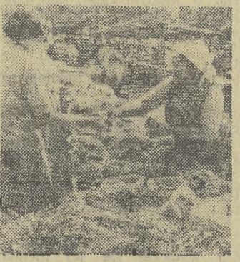
Rozsada na Kleparzu ma ogromne powodzenie wśród działkowców.

KLUB Młodych Twórców Kultury „Forum” otrzymał nową siedzibę przy ul. Mikołajskiej 2. Będzie to pierwsza samodzielna placówka tego typu objęta przez ruch młodzieżowy. Nowy lokal składa się z sali widowiskowej, dwu sal klubowych, galerii i bufetu. Całość liczy 340 m kw. powierzchni. Tam właśnie prowadzić zamierzają swą działalność m. in. Młodzieżowa Wszechnica Dziennikarska, Forum Myśli Politycznej, Zespół Upowszechniania Kultury Filmowej, kabaret i in. (w)