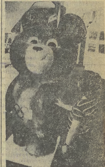
W pawilonie ZSRR na 52. MTP symbol Olimpiady wzbudza duże zainteresowanie nie tylko dzieci.

JUTRO pogoda w rejonie Krakowa kształtować się będzie pod wpływem niżu. Zachmurzenie umiarkowane, okresami duże. W ciągu dnia przelotne opady deszczu i lokalnie burze. Wiatry pld.-wsch. i pld. 3-6 m/sek. Temp. maks. dniem 19-22, min. nocą 13-10 st. C. (w)