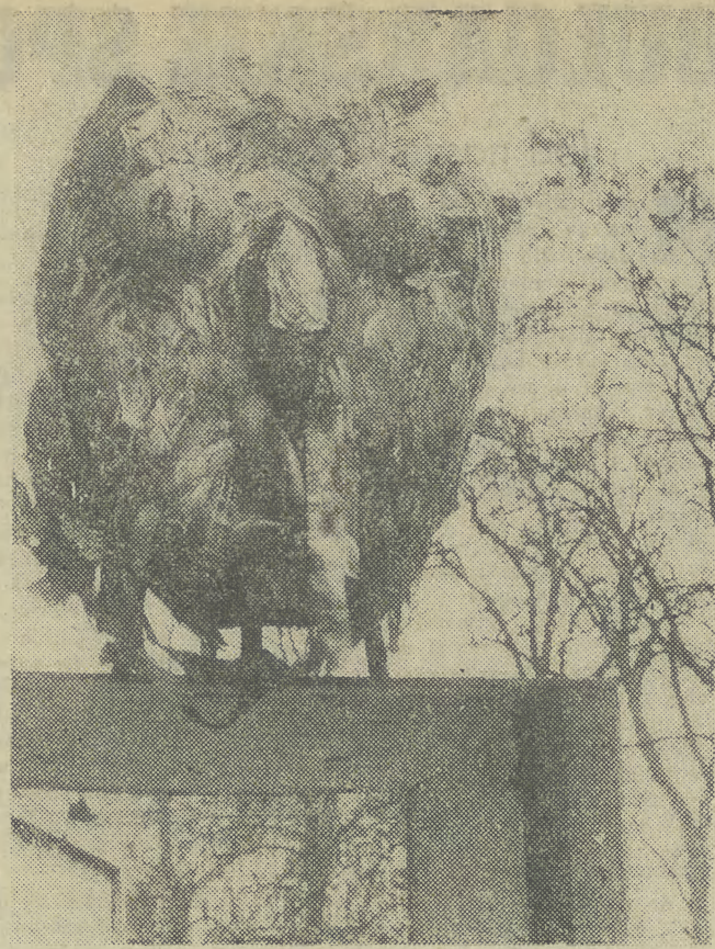
Oto niezwykle okaz ornitologiczny na Plantach. Jego wyłumaczeniem jest fakt, że to tutaj Teatru im. J. Słowackiego a sowa, wiadomo, jest rekwizytem.