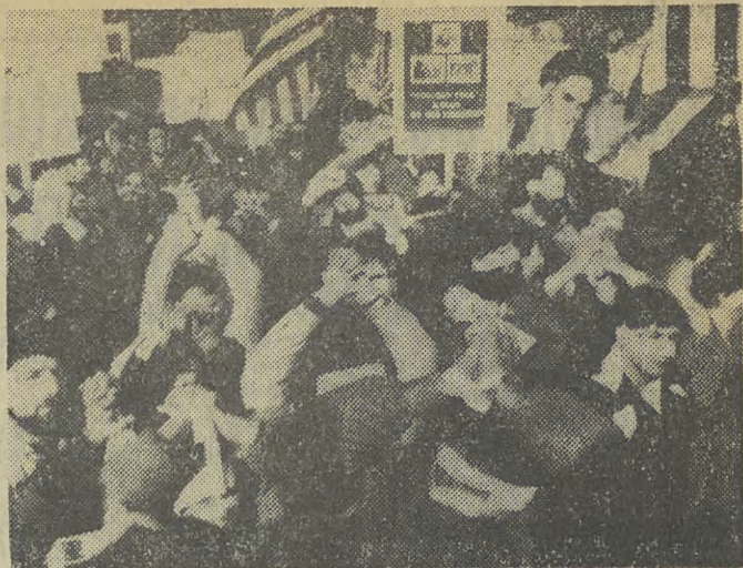
Demonstracja przed Białym Domem w Waszyngtonie zorganizowana dla poparcia starań o uwolnienie amerykańskich zakładników w Teheranie. Uczestnicy demonstracji przemaszewali ze związanymi w przegubach dłońmi i w symbolicznych maskach na twarzy.

W PRZEDZIEN oficjalnego wejścia w życie zawieszenia broni w Rodezji, współprzewodniczący Frontu Patriotycznego Zimbabwe — R. Mugabe, zwrócił się w czwartek do partyzantów kierowanego przez siebie skrzydła frontu, aby nie oddawali broni, gromadząc się w wyznaczonych porozumieniem londyńskim obozach. Mugabe podkreślił, że bron to najlepszy obrońca przed „brudnymi chwytami”.