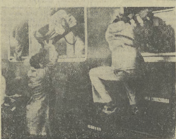
Świąteczny szczyt we Włoszech. Na dworcach tłok jak w innych krajach; do pociągu niejednokrotnie trzeba wchodzić oknem, tak jak to widać na obrazku z dworca centralnego w Rzymie.

● Osoby, które ubiegają się o odznakę złotą z pawim piórem, wybierają dowolną trasę. Na wszystkich uczestników naszej akcji czekają atrakcyjne trasy po starym i nowym Krakowie. Czekaj na Was, Drodzy Czytelnicy, odznaka PRZYJACIELA KRAKOWA. Zapraszamy! (kas)