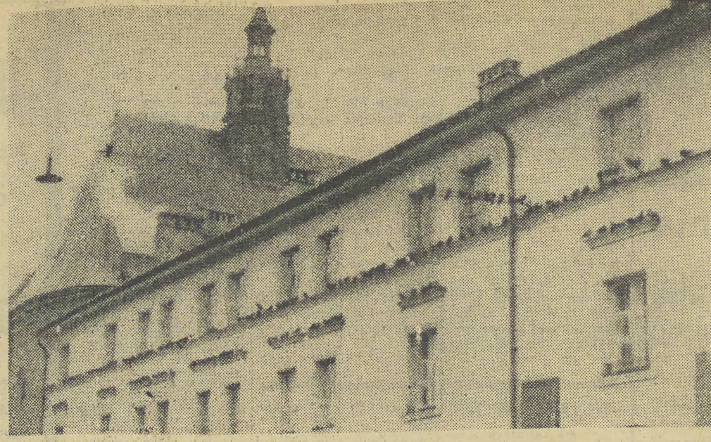
W chłodne dni gębie obsiadają parapety domów tworząc osoblwe, żywe fryzy...