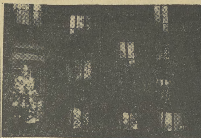
Choinka w każdym oknie...

Przedprzedaż biletów prowadzi „Filmotechnika”, ul. św. Krzyża 5. K-8981