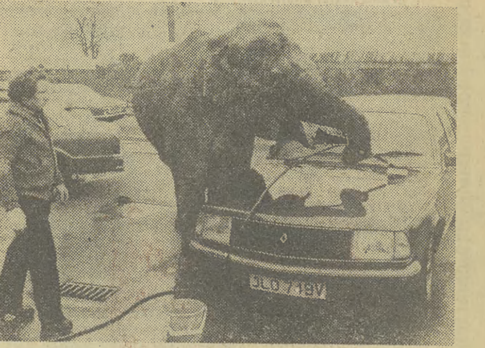
W jednym z londyńskich garaży kilka cyrkowych słoni pomagało myć i tankować samochody. Był to rewanż ze strony dyrekcji cyrku, którego wozy bezpłatnie parkowały na terenie garażu.