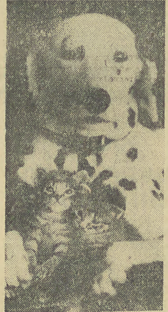
Nie mając własnych dzieci można uczucia macierzyńskie przełożyć na przybrane... Zdarzyło się to tej suse — dalmatyńczykowi, która przeżywając swoją urojoną ciężą przyhołubiła dwoje kociąt.

— Właśnie! Jest wiele przedsiębiorstw, które narzekają na brak pomieszczeń magazynowych i starają się o ich budowę, co przy obecnych ograniczeniach inwestycyjnych jest bardzo trudną sprawą. Tymczasem jest bardzo proste wyjście — skorzystać z usług PSK. Wówczas zamiast budować setki magazynów w setkach zakładów przemysłowych, wystarczy wybudować kilka ma-