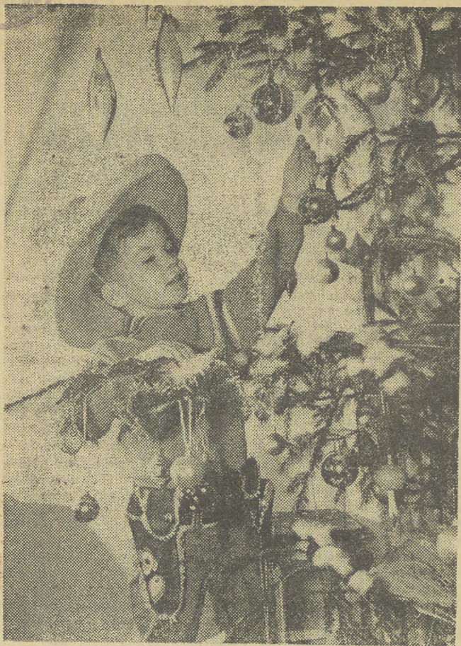
Ubiertanie choinki to jeden z najpiękniejszych i najmiej wspomnianych przez nas zwyczajów świątecznych.