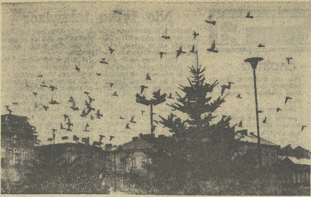
Obfitość gołębi mamy nie tylko na Rynku Głównym, ale i Podgórskim.