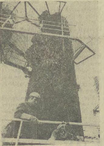
Trwa budowa Zakładów Chemicznych POLICE II — największego polskiego kombinatu nawozowego. Najbardziej zaawansowane są prace przy wznoszeniu wytwórni amoniaku o docelowej zdolności produkcyjnej 500 tys. ton rocznie.

W dyskusji, którą prowadził prof. Józef Pajestka, główny nacisk kładziono na sprawę metodologiczną i merytoryczną przygotowania prognozy „Przyszły obraz Polski”.