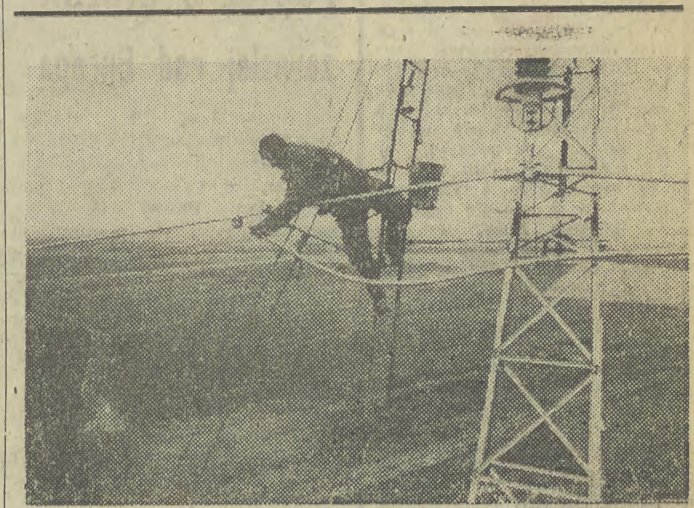
Równoległe z budową elektrowni w Polańcu trwa rozbudowa systemu przesyłowych linii energetycznych wysokiego napięcia na terenie pld-wsch. Polski. Brygady budowy sieci elektrycznych krakowskiego „Elbudu” pracują m. in. przy budowie linii energetycznej Polaniec — Rzeszów.

ROK XXXIV PISMO POPOŁUDNIOWE Nr 283 (10548) ODZNACZONE ZŁOTĄ ODZNAKĄ M. KRAKOWA