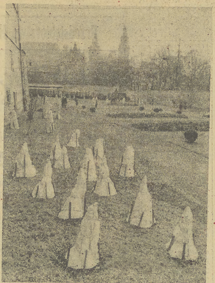
Zimowe chochoty na straży Muzeum Archeologicznego.

• Jak donoszą dzienniki moskiewskie stan zdrowia hr. Tolstoją jest znowu bardzo groźny. Dotkliwie bóle woreczka żółciowego to zwiększają się, to zmniejszają. Serce bije słabo. Chory jest niezmiernie osłabiony i nie może poruszać się o własnej sile. „Czas”