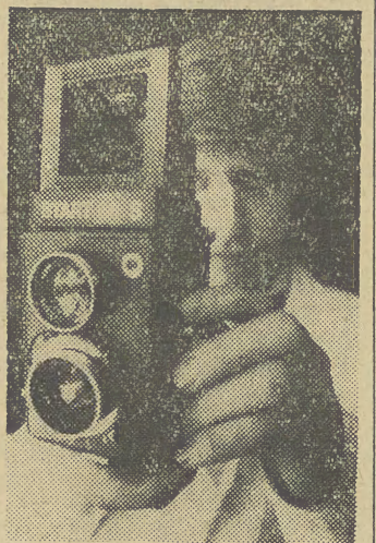
Polskie Zakłady Optyczne w Warszawie, nasz największy wytwórca sprzętu dla aparatów rozpoczęła produkcję aparatów fotograficznych „Start 66 S”. Są to zmodernizowane lustrzanki dwuobiektywowe.

ŚFZZ wzywa związkowców, by domagali się od rządów swych krajów, aby odmówili realizacji decyzji NATO.