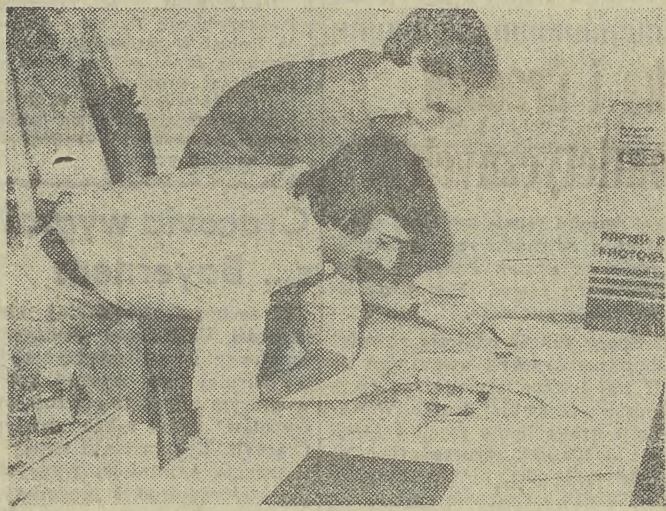
Rodzi się pierwsza koncepcja słowiańskiego grodu.