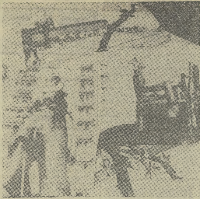
Tak bawią się już dzieci w Kolobrzegu.