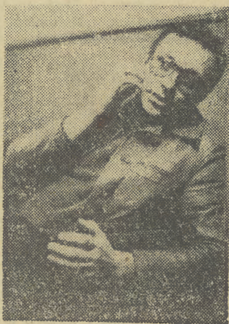
Podjąłem tę pracę m. in. dlatego, że zaproponował mi to Teatr Stary...