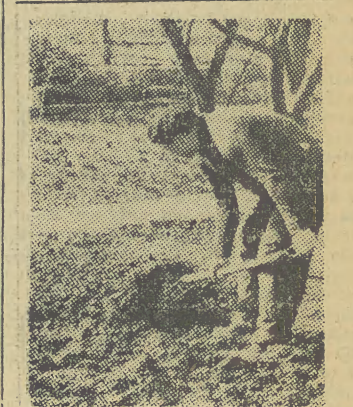
Pierwsze dni wiosny — to sygnał dla wszystkich działkowców.

Wczoraj abp. Casaroli — udał się do Międzylesia, gdzie wznoszona jest unikatowa w świecie placówka medyczna — pomnik-szpital Centrum Zdrowia Dziecka.