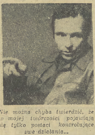
Nie można chyba twierdzić, że w mojej twórczości pojawiają się tylko postaci kontrolujące swe działania... (Rozmowę z K. Zanussim zamieszczamy na str. 4.)