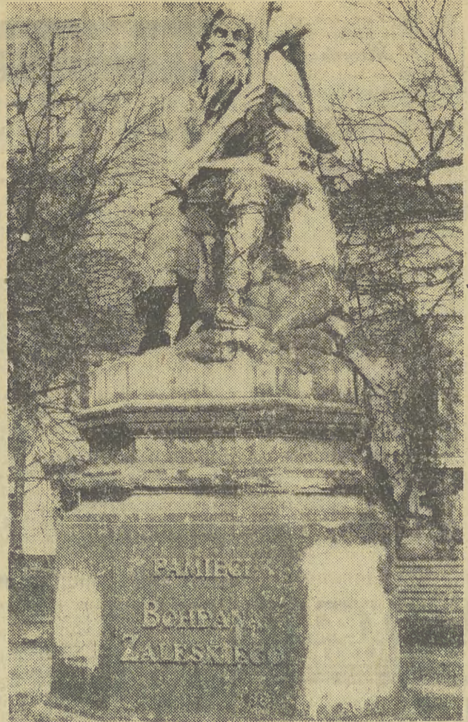
Zieleń Plant jeszcze nie przystania pomników, ani nie osłania śladów zniszczenia. Pomnik pamięci lirnika Bohdana Zaleskiego, dłuta Piusa Welońskiego powstał w 1836 roku. Wiemy o tym, jednak tylko z przekazów pisanych, bowiem z cokołu pomnika odpadły już cyfry, a i kamienny cokół jest poważnie zniszczony.