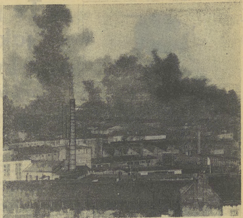
Zakładów przemysłowych z kominami nie buduje się na dziś. Popelnione błędy będą znowu nie do odrobienia w okresie co najmniej półwiecza.

Wstępne rozeznanie pozwala sądzić, że przy realizacji programu „WISŁA” przerzucąc będziemy rocznie 14 mln m sześć. ziemi i wylewać około 530 tys. m sześć. betonu. (JK)