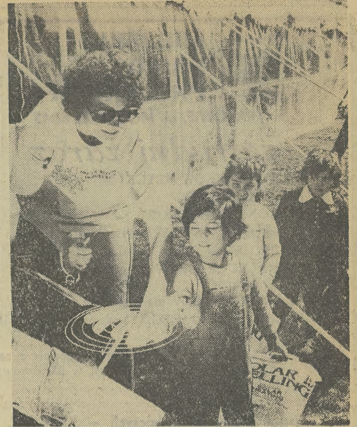
Podczas gdy marzniemy, w cieplejszych krajach słońca używają nawet do smażenia parówek na campingu przy pomocy specjalnego „ruszty słonecznego”...

Miłośnicy muzyki — nie tylko polskich, ale i zagranicznych radiofonii — znają krakowską Orkiestrę i Chór PR i TV z niezliczonej ilości różnorodnych nagrań: od muzyki rozrywkowej — po dzieła monumentalnej symfoniki. Zwłaszcza — twórczości kompozytorów polskich: Chopina, Moniuszki, Szymanowskiego, Karłowicza, Pendereckiego, Lutosławskiego... Krakowianie spotykają się z zespołem radiowo-telewizyjnym w sali Filharmonii na comiesięcznych, z reguły atrakcyjnych koncertach. W tym roku jubileuszowe trzydziestolecie oklaski publiczności dla zespołu będą na pewno szczególnie żywe i serdeczne. JERZY PARZEŃSKI