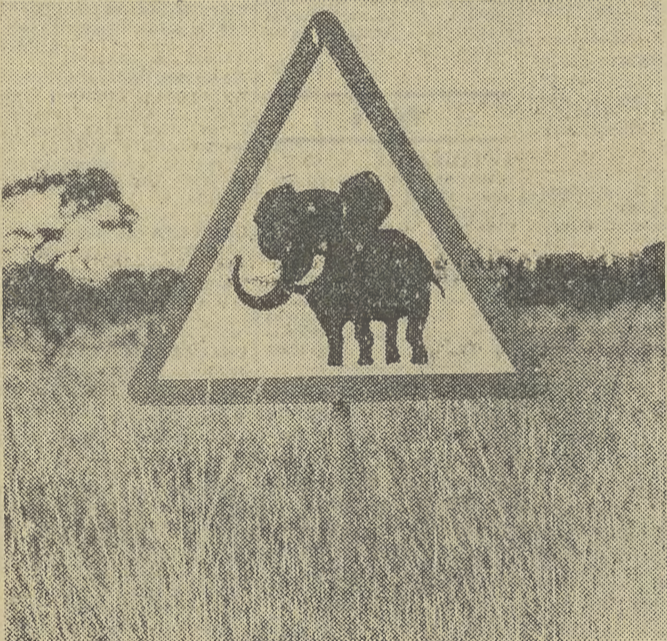
W Polsce — uwaga na krowy, w Tanzanii — uwaga na słonie...

Jak wynika ze spisu przeprowadzonego w Rumunii w 1977 r., w kraju tym żyje 4,756 obywateli, którzy w rubryce narodowość wpisali — polska. Z liczby tej blisko 1700 mieszka w dwóch, położonych w Karpatach na Bukowinie górskich gminach o nazwach Caciua i Monastyr Humorului. W pierwszej z tych gmin, we wsi Nowy Soloniec, zaś w drugiej w Polana Micului i Plesza. Przyszli tutaj po prostu za chlebem w 1792 r., zachęcani obietnicami dobrych zarobków w miejscowej kopalni soli. Czynna jest ona do dzisiaj. Stąd pochodzi najpiękniejsza, najczystsza w Rumunii sól jadalna. W trzech miejscowych szkołach program obejmuje także i naukę języka polskiego. Polska przekazała niedawno tym szkołom 160 książek i albumów, wiele pomocy szkolnych, m. in. magnetofony z nagraniami naszych narodowych baśni i poezji dla dzieci i młodzieży.