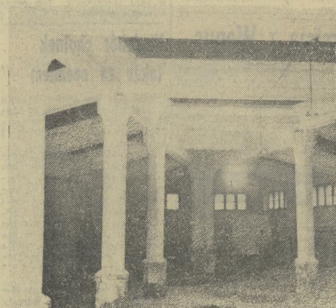
Hala wsparta na kolumnach to miejsce przyszłych wystaw.