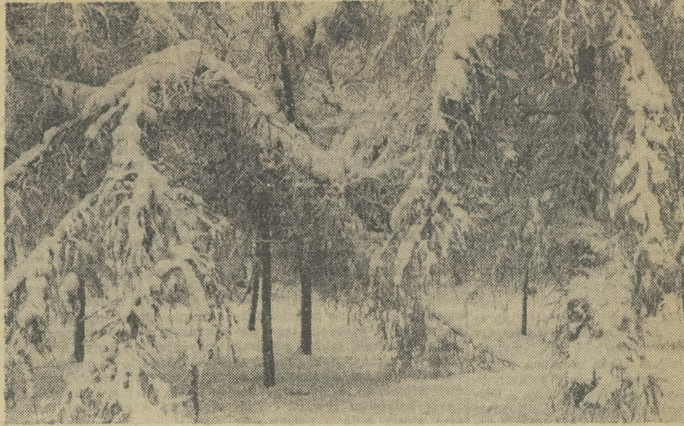
Ten ośnieżony las to centrum Krakowa — park Krakowski.

— Cały rok robimy te świecidełka. Może w innych budkach jest więcej choinkowych zabawek nowoczesnych, ale ja lubię moje i wydaje mi się, że dzieci także wola te papierowe ozdoby, takie same jakie były w