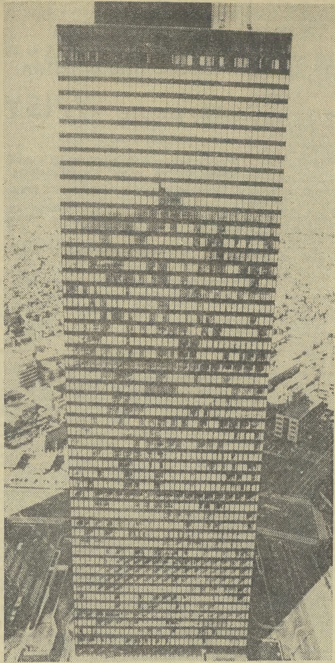
55-piętrowy gmach, należący do koncernu przemysłowego Mitsui, jest jednym z najwyższych budynków w Tokio. Konstruuje on bardzo z niską, najwyższą kilkupiętrową, zabudową Shinjuku, jednej z dzielnic stolicy Japonii.