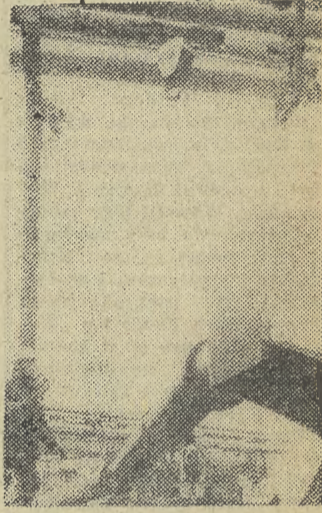
HUTA „KATOWICE” Tysiące specjalistów z wielu załóg budowlanych, montażowych i rozruchowych nie szczędzą trudu, aby prace przy wszystkich obiektach drugiego wielkiego pieca wykonać w terminie.

wadzających popychaczy, zamków oraz powierzchni uszczelniających węzła cumowniczego.