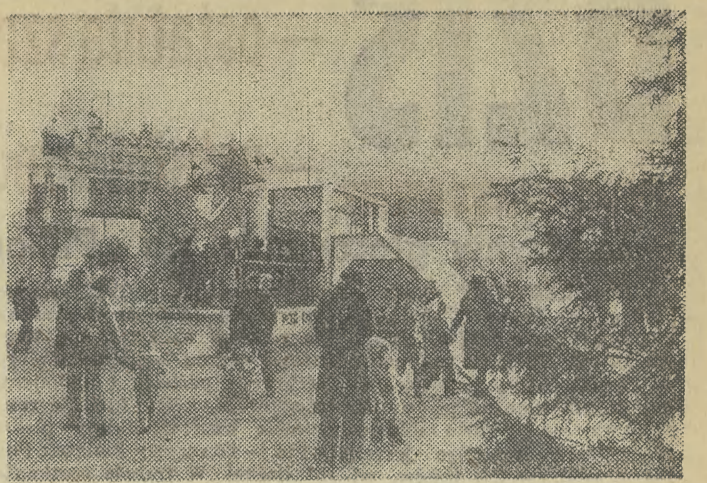
Najefektowniejsze kiermasze w stoisko z upominkami pod choinkę zgotował nam Dom Książki, który „wjechał” na Rynek niezwykłym samochodem.

O wszystkich tych sprawach mówiono wczoraj podczas posiedzenia Komisji Gospodarki Komunalnej, Komunikacji i Łączności RN m. Krakowa.