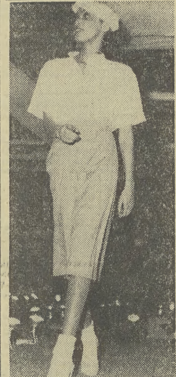
Ten model pochodzi z pokazu najnowszej kolekcji Międzynarodowego Sekretariatu Welnj. Pokaz odbył się ostatnio w Łodzi.