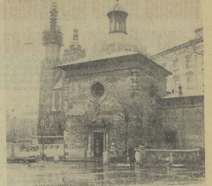
Resztki śniegu zniknęły z ulic i placów Krakowa, odsłaniając wszystko to co brudne i brzydkie. Ludzie brzoza w błocie i

KURS DLA KANDYDATÓW na Przewodników Turystyki Górskiej na obszar Beskidów Zachodnich i Wschodnich organizuje Krak. Klub Przewodników Turystyki Górskiej PTTK. Rozpoczęcie kursu 24 I 1978 r. Zgłoszenia wraz z opłatą przyjmują skarbnik Klubu w każdy poniedziałek w godz. 18-19 w Oddziale PTTK Kraków, ul. Warszawska 21.