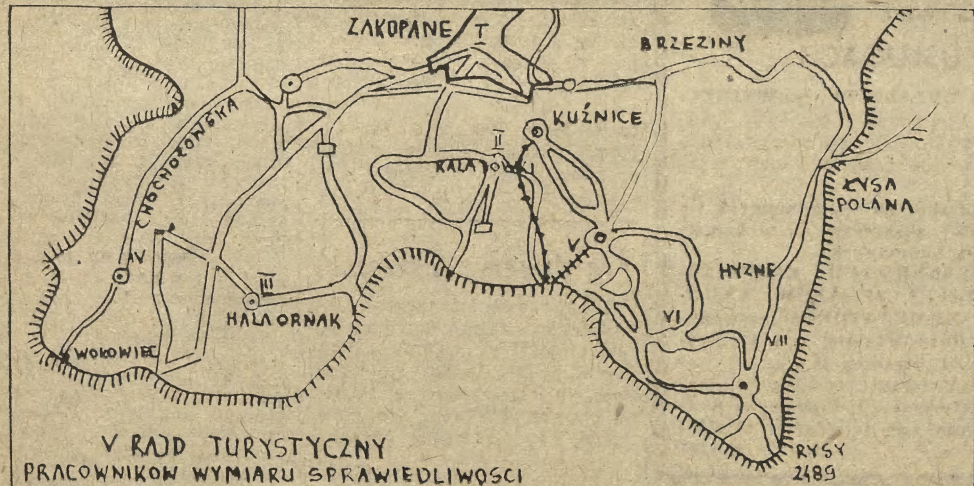
V RAJD TURYSTYCZNY PRACOWNIKÓW WYMIARU SPRAWIEDLIWOŚCI