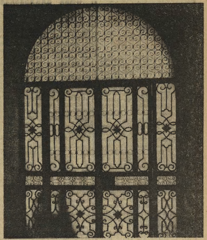
Urode krakowskich sieni warto pokazać. Na zdjęciu: sieni w budynku przy ul. Grodzkiej 13.