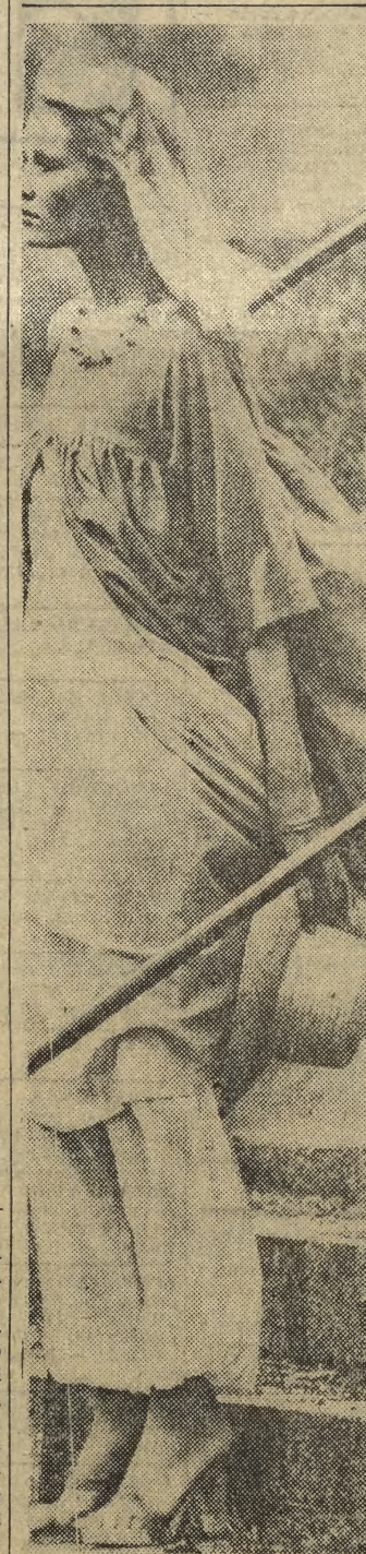
CZYŻBY POŻEGNANIE LAT?