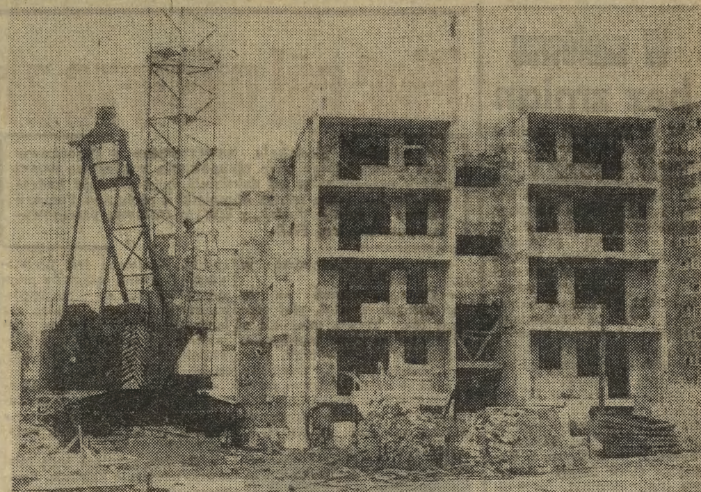
Typowe dla Nowej Huty bloki „puchatki” rosną jak na drożdżach.