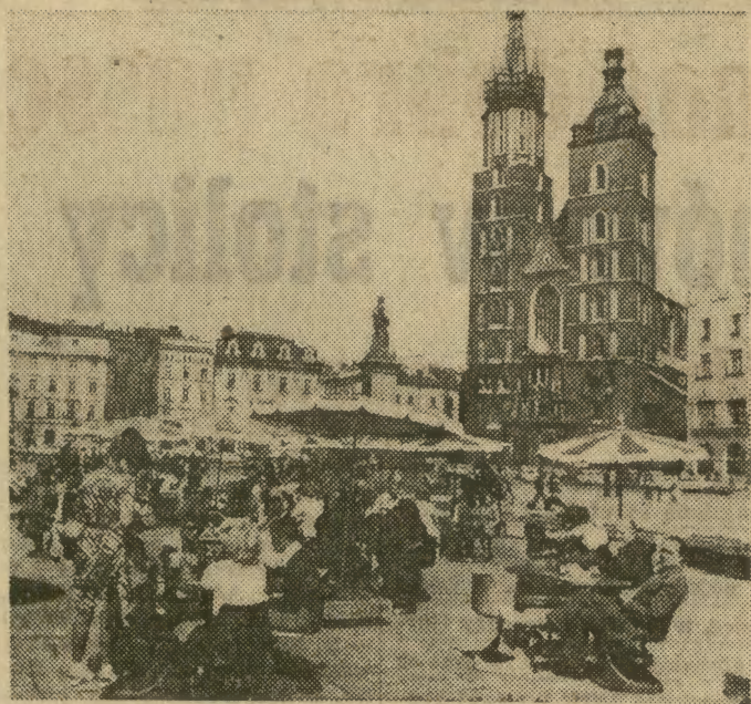
— Jeszcze jest na tyle ciepło i ładnie, że można posiedzieć w kawiarni pod parasolami na Rynku Gł. w uroczej scenierii Starożytności.

w Porębie Wielkiej k. Myślenic rozpoczyna się budowę własnego ośrodka wypoczynku niedzielno - świątecznego. Inwestycja ta zainicjowana w roku jubileuszowym stanie się pięknym upamiętnieniem złotych godów „Stomilu”. Ponadto ofensywa „Stomilu” skierowała się w rejon Dobczyc. Tam właśnie usytuowano zakłady satelitarne. Zmontowano już ogromną halę — w przyszłym roku ma być gotowa następna jeszcze większa o powierzchni 1500 m kw. W sąsiedztwie powstanie żłobek i przedszkole oraz dom mieszkalny dla wielu rodzin pracowników zakładów satelitarnych krakowskiego „Stomilu”. (bp)