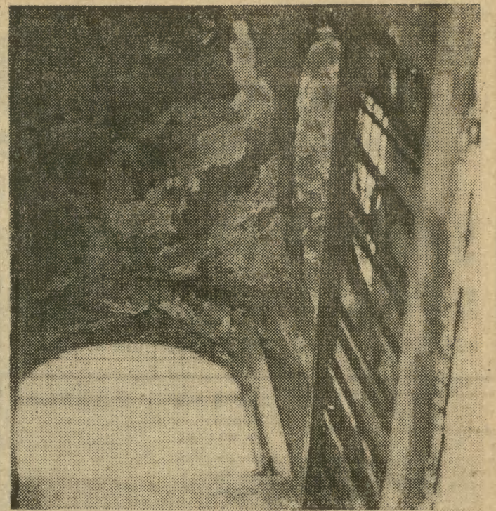
Tak obecnie wygląda klatka schodowa w kamienicy „Wierzynek”.