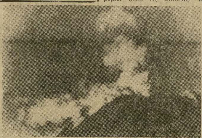
N/z: dymiący wulkan na Gwadelupie.