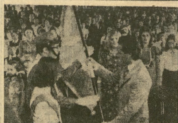
Moment przekazania sztandaru uczniom szkoły.