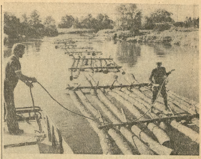
Na jeziorach mazurskich rozpoczęły się pierwsze w tym sezonie transporty drewna, spławiane do tartaków położonych w tych rejonach. Przez jezioro Roś płyną wielkie tratwy ciągnięte przez holowniki do magazynu Piskich Zakładów Przemysłu Sklepek. Potężne bale drewna ściągane z Puszczy Piskiej i magazynowane w wodzie, nie ulegają zniszczeniu przez korniki. Jest to najwłaściwsza konserwacja surowca, na który oczekuje wiele naszych zakładów przemysłowych. Na zdjęciu: tratwy z drewna holowane przez jednostkę Żegluga Mazurskiej w Giżycku, płyną rzeką Pisą na jez. Roś, gdzie znajduje się wodny magazyn ZPS.