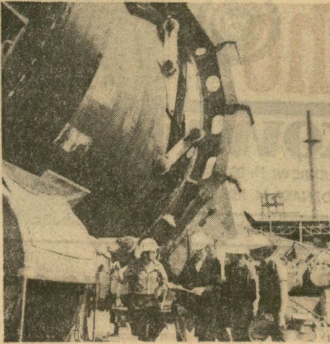
BUDOWA CEMENTOWNI STRZELCE OPOLSKIE

Po koncercie, Edward Gierek i Henryk Jabłoński spotkali się z przedstawicielami świata twórców i działaczy kultury. Spotkanie upłynęło w serdecznej atmosferze.