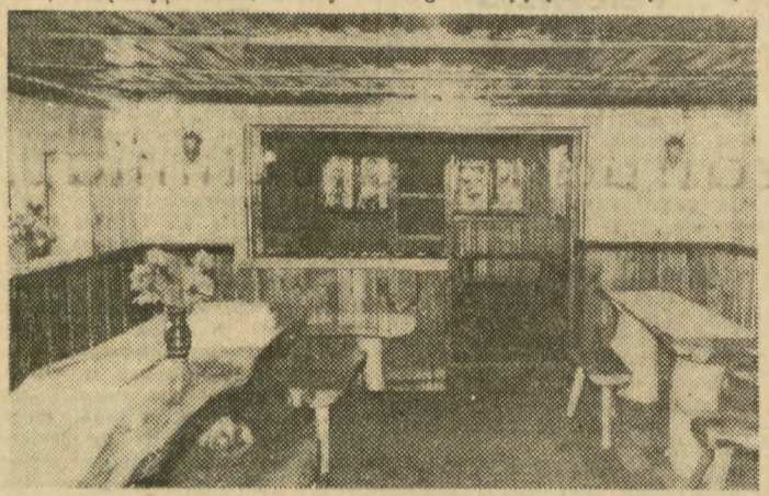
Świetlica w zakopiańskim, góralskim domu, należącym do krakowskiego „Stomilu”.

A POZA TYM: ★ 30 i 31 bm. w Kabarecie „Pianino” (KDK, Rynek Gł. 27) o godz. 20 recital aktorski Jerzego Kopcewskiego-Buleckiego pt. „Kirelejson” wg Konopiecki.