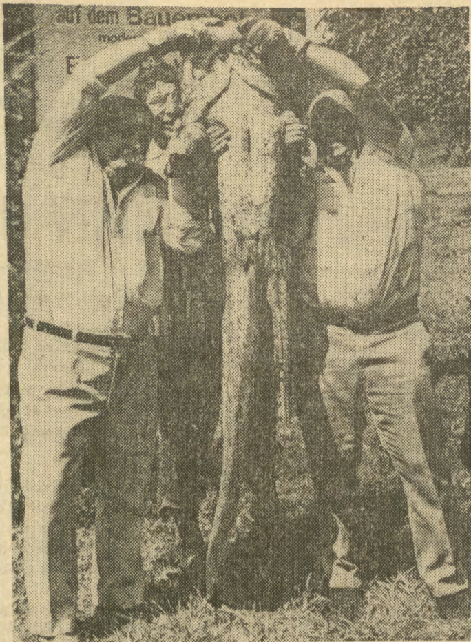
90 minut trwała walka trzech wędkarzy z tą olbrzymią rybą wylowioną w małej rzeczce Regan w RFN. Okaz ma 2 metry długości i waży ponad 50 kg.

S ąd apelacyjny w stanie New York zatwierdził orzeczenie sądu niższej instancji, który zalecił wypłatę stałego zasiłku pracownicy Wlen Aronson, chociaż sama zrezygnowała z pracy. Sąd ustalił, że musiała ona dojeżdżać do pracy koleją podziemną, gdzie w ciągu pięciu miesięcy już trzy razy została ograbiona przez bandytów. Sędzia uznał jej strach za wystarczający i zrozumiały powód rezygnacji z pracy. (m.b.)