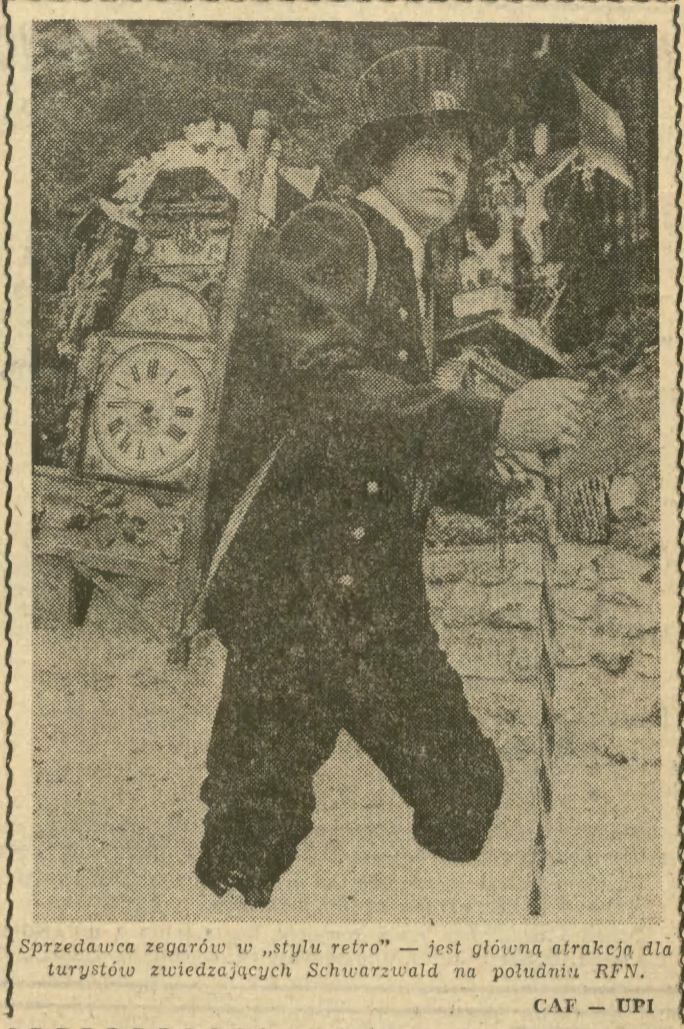
Przedawca zegarów w „stylu retro” — jest główną atrakcją dla turystów zwiedzających Schwarzwald na południu RFN.