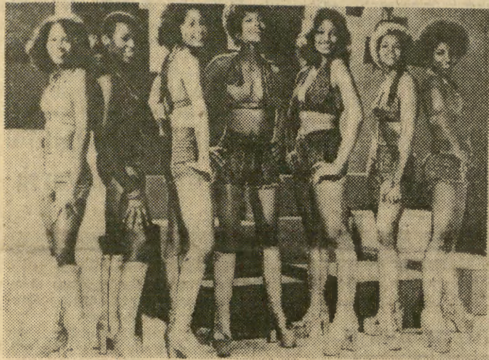
Te zgrabne dziewczyny w kostiumach w stylu „jeans” — to popularny zespół „The Love Machine”. Zdjęcie wykonane w Holandii podczas tournée piosenkarzkiego zespołu po Europie.