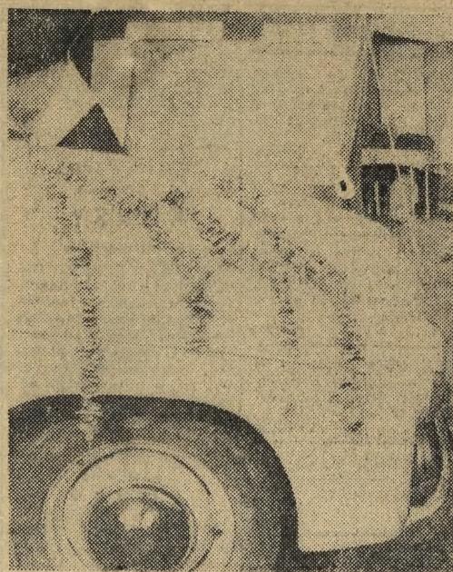
Z każdej wycieczki samochodowej można przywieźć sobie wianuszek suszonych grzybów. Jak suszyć? Chociażby tak, jak widzimy to na naszym zdjęciu.

cializujących się w produkcji zwierzęcej niespodziankę (z której ma prawo być dumny) nasiona rewelacyjnej odmiany buraków pastewnych „polipast”. Odmiana ta daje wysokie plony, a dzięki zawartości aż 14 proc. cukru jest świetną paszą. Kto zgłosi chęć wypróbowania tego buraka, temu zapewnią się nieodpłatnie nasiona i fachowo przeprowadzony wysiew. (hs)