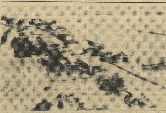
Na zdjęciu — tereny powodziowe w prowincji Tarlac, na Filipinach.

KAIR Izrael odrzucił ponownie propozycję Jordanii, sugerującą podjęcie rozmów na temat rozdzielania wojsk jordańskich i izraelskich wzdłuż rzeki Jordan. Jest to reakcja na sugestie tego rodzaju, zawarte w komunikacie jordańsko-amerykańskim opublikowanym na zakończenie wizyty króla Husajna w Waszyngtonie.