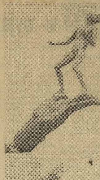
Sztokholm. Jedną z fascynujących rzeźb w słynnym „ogrodzie Millesa”.

Jej oczy zatrzymały się na mojej twarzy. Bąknęła niewyraźnie: