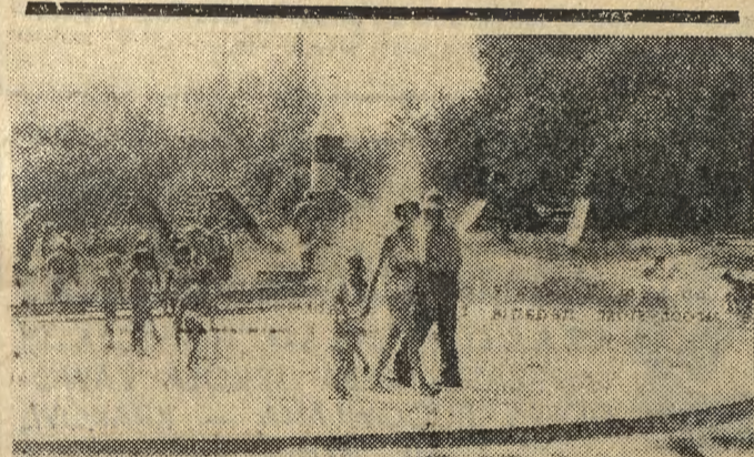
Maluchom i ich opiekunom najprzyjemniej w upalne południe w „brodniku”, w Parku Jordana.

Stupek tęci wskazuje ponad 35 stopni w cieniu. Nawet niebo jakby wyblakło z gorąca. Sobota 17 sierpnia br. Według telewizyjnego „Wicherka” najgorętszy dzień tego lata. Jeszcze kilka dni temu darmo pragnęliśmy by słońce wyjrzało zza chmur, a teraz szukamy cienia by uciec przed jego promieniami choć na chwilę.