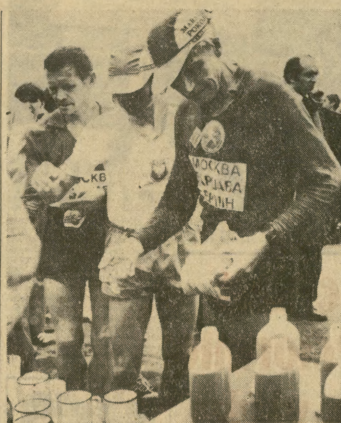
„MIRATON POKOJU” MOSKWA — WARSZAWA — BERLIN. W Terespolu do biegaczy radzieckich dołączyli polscy uczestnicy imprezy. Na zdjęciu: na punkcie zwieleniowym w okolicach Białej Podlaskiej.