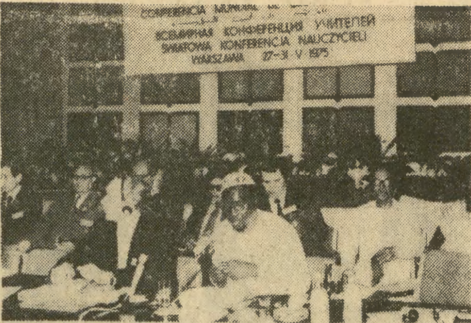
Jak już informowaliśmy — w Warszawie rozpoczęła się wczoraj Światowa Konferencja Nauczycieli, zwołana z inicjatywy Światowej Federacji Związków Nauczycielskich. Uczestnicy obrad wymieniają poglądy i doświadczenia przyszłości szkoły, społecznej wartości wykształcenia i jego roli w rozwoju sił produkcyjnych, przedyskutują zagadnienia wizerunku kształcenia z gospodarką narodową i rolę pracowników oświaty w społeczeństwie. Do uczestników konferencji skierował list premier Piotr Jaroszewicz, który objął honorowy protektorat nad konferencją.

Kraków, środa 28, czwartek 29 maja 1975 r.