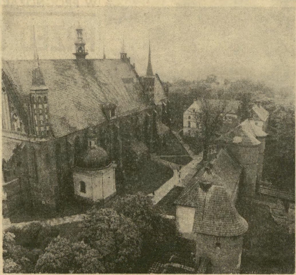
FROMBORK ZAPRASZA Pierwsi turyści wyruszyli już na szlaki wycieczkowe. Wkrótce będzie ich coraz więcej, szczególnie w nadchodzących miesiącach wakacyjnych. Nasze ośrodki turystyczne przygotowują się na przyjęcie licznych gości. We Fromborku — pięknym mieście — grodzie Kopernika, na pewno nie zabraknie krajowych i zagranicznych miłośników turystyki. To stare miasteczko słynne jest z czystości i gościnności. Gospodarze starają się o coraz więcej atrakcji dla wszystkich przyjeżdżających. Frombork widziany z góry. (hś)