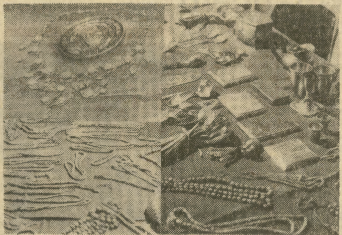
Odzyskane przez MO przedmioty, odebrane sprawcom włamania do „Desy” — m. in. renesansowy medalion i złoty filigranowy naszyjnik z perłami oraz 4 kg korali i srebra.

Oświadczone zgodnie, że u żadnego z badanych nie stwierdzono ani choroby psychicznej, ani niedorozwoju umysłowego.