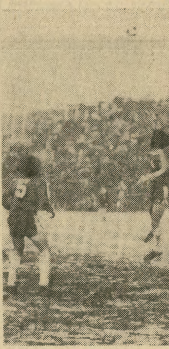
Reprezentacja Polski pokonała zespół USA 7:0. Na zdjęciu w białej koszulce Grzegorz Lato, obok niego w głębi Andrzej Szarmach — zdobywcy 4 bramek dla polskiej jedenastki.

Kierowcy i studenci mogą zgłaszać się do Agencji „Provoya” codziennie od godz. 13 do 16, w budynku AE przy ul. Rakowickiej 27b, tel. 252-80, wewn. 378.