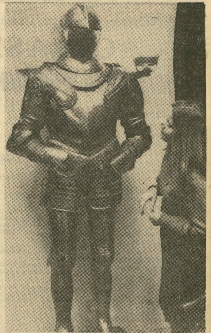
W salach wrocławskiego Ratusza otwarto ostatnio ciekawą wystawę pt. „Arcydziela oręża”. 150 eksponatów, które znajdują się na wystawie, pochodzi ze zbiorów leningradzkiego Ermitażu, a ilustrują one rozwój sztuki wytwarzania broni i uzbrojenia tak zachodnioeuropejskiego, blisko wschodniego jak i indyjskiego. Wrocławską wystawę zorganizowana została w ramach wymiany kulturalnej między muzeami radzieckimi a polskimi.