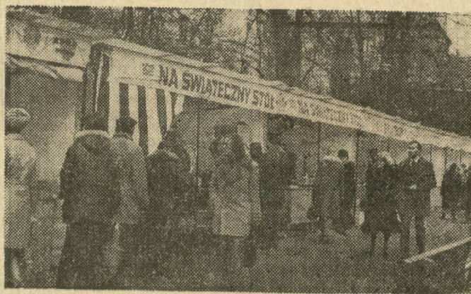
Na zdjęciu: przedświąteczny kiermasz na Plantach.

Nie dość, że na wielu przystankach miejskiej komunikacji brakuje daszków, chroniących przed śniegiem i deszczem, to istniejące przedstawiają opłakany widok: brudne, nie odmalowane konstrukcje, często niezbyt szlachetny dach itp. Kiedy wreszcie zajmie się ich renowacją MPK? W pobliżu przystanków trzeba by ustawić również więcej ławek oraz koszy na śmieci. (ja)