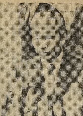
Thuy, z lewej — szef delegacji USA William Porter. Minister Thuy oświadczył, że „wypowiedzi Nixona dowodzą, iż ciągle jeszcze istnieje głęboka przepaść między jego słowami a czynami”. Oświadczył on, że wkrótce przybędzie do Paryża specjalny doradca delegacji DRW — Le Duc Tho, który prowadził m. in. poufne rozmowy z doradcą prezydenta USA, Nixona — H. Kissingerem.