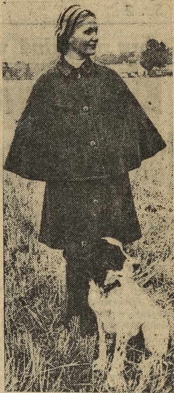
Oto pomysł niewątpliwie bardzo praktyczny i wart naśladowania: wetniany „bezrekawnik” oraz krótka pelerynka z tej samej tkaniny. Bezrekawnik noszony ze swetrem-golfem i spodniami oraz pelerynka — to strój idealny na wiosenne spacer, na urlop...

Tematem rozmów był dalszy rozwój współpracy gospodarczej, politycznej i kulturalnej między Polską a Republiką Ukrainą.