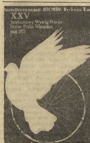
Reprodukcja jednego z plakatów (proj. A. Krzysztoforski) wydanych z okazji zbliżającego się XXV Wyścigu Pokoju.