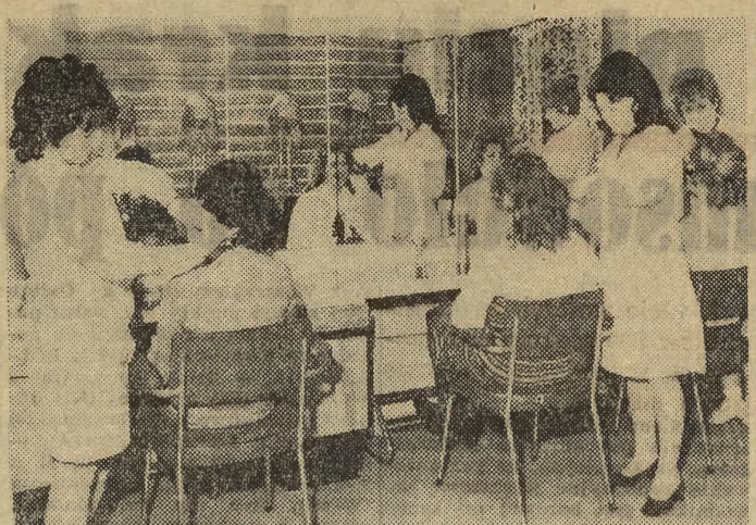
PSS „Społem” uruchomiła wczoraj przy ul. Lubież 19 ośrodek „Praktycznej Pani”. Jest to placówka o nowoczesnym i funkcjonalnym urządzeniem wnętrza, zaprojektowanym przez mgr inż. A. Chelmeckiego. Generalnym wykonawcą przebudowy i adaptacji starych pomieszczeń były Zakłady Remontowo-Budowlane PSS. Trzeba przyznać, że wszystkie prace wykonano bardzo starannie.

że stycamy się z bardzo dobrą fotografią, świadcząca o specjalnym wyczuceniu autora na smutne, nieraz bardzo smutne strony życia. (e)