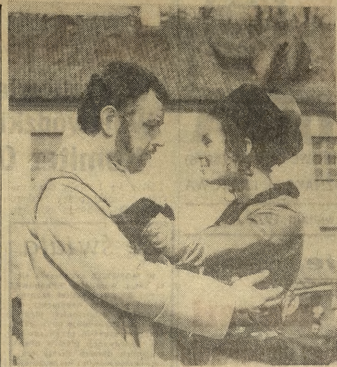
„JANOSIK” NA PLANIE

ADRES REDAKCJI: Kraków, ul. Wiślna 2. Nie zamówionych materiałów redakcja nie zwraca.