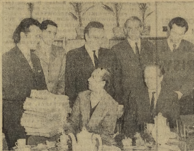
W świetlicy Szkoły Podstawowej nr 33 im. Janka Krasickiego przy ul. Konarskiego 2 w dzielnicy

Przypomnijmy, że — jak dotychczas — z piosenkarzy reprezentujących ziemię krakowską na zielonogórskich festiwalach największy sukces odniosła tarnowianka Urszula Smoła, która w roku 1970 zajęła drugie miejsce. (ZH)