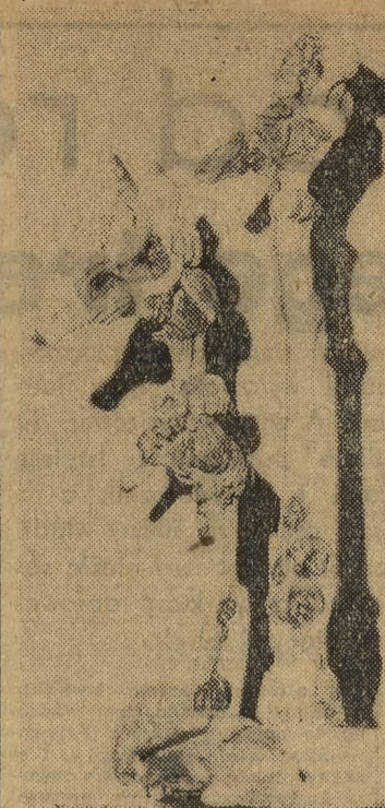
To, co państwo oglądacie to eksponat z wystawy korzenioplastyki w KDK. Prezentowany korzeń — pochodzi z drzewa jaluca i misterne kształty jakie przybrał, nie wynikały z wpływu ludzkiej ręki a jedynie... z choroby drzewa, która spowodowała owe fityzyczne narosłe. Cała sztuka w tym, by z korzenia wydobyc jego naturalne walory. (bn)