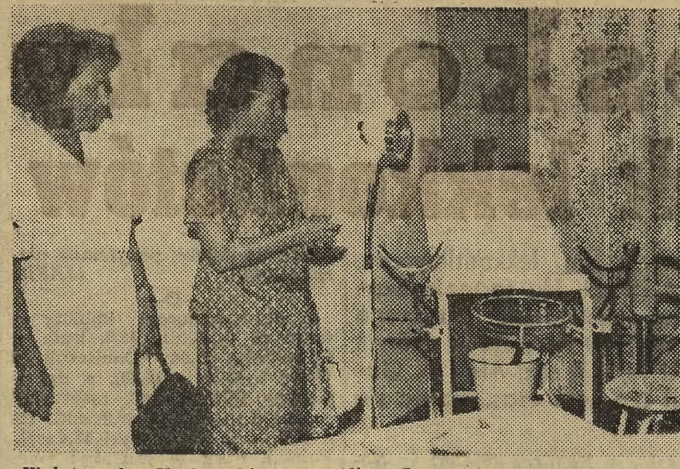
W lutym br. Krakowskie Towarzystwo Świadomego Macierzyństwa otrzymało lokal w budynku przy ul. Boh. Stalingradu 13. Pomieszczenia zostały odremontowane i zaadaptowane do potrzeb utworzonej przez TSM — Młodzieżowej Przychodni Profilaktycznej, przeznaczonej dla uczniów szkół podstawowych i średnich, studentów oraz młodych — pracujących. W 8 gabinetach Przychodni — lekarze, socjologowie, prawnicy odbywają będą z młodymi (połączone z poradnictwem), indywidualne rozmowy z zakresu problemów zdrowotnych i społecznych okresu rozwojowego człowieka.