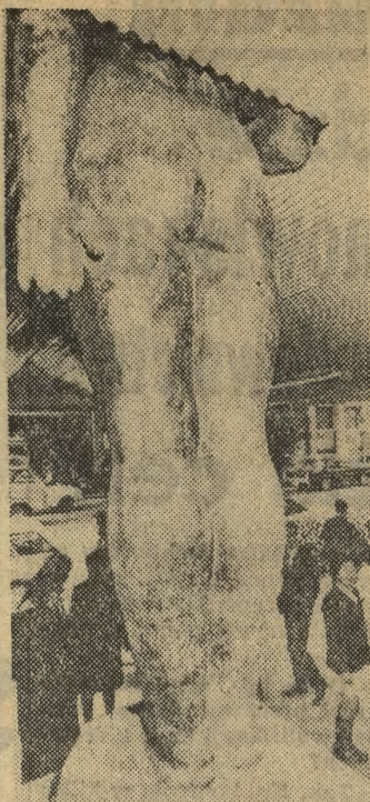
Przechodnie spoglądają zdziwieni i rozbawieni na posąg, który „wyrósł” niedawno w tokijskiej dzielnicy handlowej Ginza. Ścisła rzecz biorąc, widoczna jest tylko dolna część figury (na zdjęciu) — reszta znajduje się... na drugim piętrze Galerii Sztuki, zastonięta przed oczyma ciekawych do chwili zakończenia prac przy urządzaniu wystawy.

LISTY MIŁOSNE DAWNYCH POLAKÓW. Oprac. Michał Mislorny. WL 1971. Cena 13 zł.