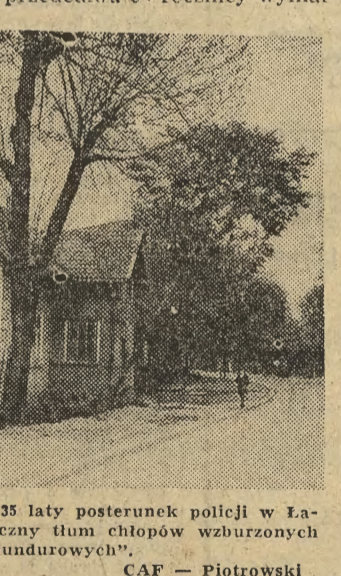
W tym budynku mieścił się przed 35 laty posterunek policji w Lapanowicach, obłożony przez wielotysięczny tłum chłopów wzburzonych bestialstwem „mundurowych”.

Rok 1972 — to także 40 rocznica pierwszej fali masowych strajków chłopskich. Bo właśnie w 1932 r. w warunkach potęgującej się nędzy na wsi i wyraźnego lekceważenia ich postulatów przez rząd i władze sanacyjne, chłopcy zaczęli organizować strajki polegające na bojkocie targów oraz wstrzymaniu dowozu produktów rolnych do miast.