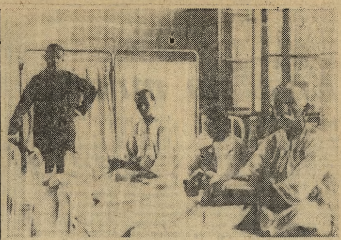
5 zabitych i 18 rannych — to krwawe żniwo masakry policyjnej w Lapanowicach. Na zdjęciu — chłopcy w szpitalu ranieni pod Lapanowem (zdjęcie dokumentalne).

— Dziękujemy za rozmowę. HELENA NOSKOWICZ