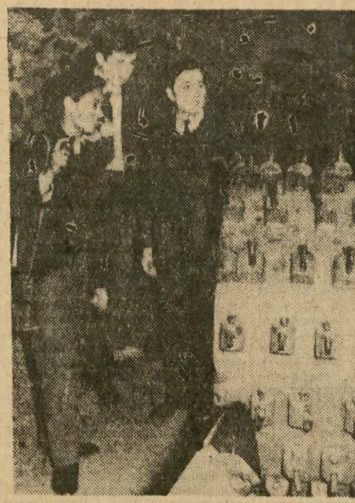
Przy al. Mickiewicza a więc w centrum Krakowa istnieje (o czym już zresztą pisaliśmy) najprawdziwsza kopalnia. Właściwie mini-kopalnia, doświadczalna ale z prawdziwym sprzętem górniczym — kombajnami, wdrażarkami itd. Tu właśnie przyszli górnicy, studenci Akademii Górniczo-Hutniczej im. Stanisława Staszica, odbywają ćwiczenia, praktyczne. Na naszym zdjęciu: ćwiczenia przy kombajnie.

Z dworca PKS w Żywcu skradziono autobus m-ki „Jez”. W wyniku zastosowanej natychmiast przez MO blokady ulic miasta pobliskich dróg autobus został zatrzymany jeszcze w obrębie rogatki Żywca. Za kierownicą siedział 19-letni Zygmunt M. z Rychnowa, mechanik samochodowy żywieckiej Ekspozytury PKS. Okazało się, że znajdował się on pod wpływem alkoholu. Wyszło też na jaw, że w trakcie swojej krótkiej przejażdżki tego narozrabiał — pojechał na poboczu liny samochodowej oraz najechał na przydrożny stęp. Dobrze, że napotkani po drodze przechodnie uszli z życiem! (z)