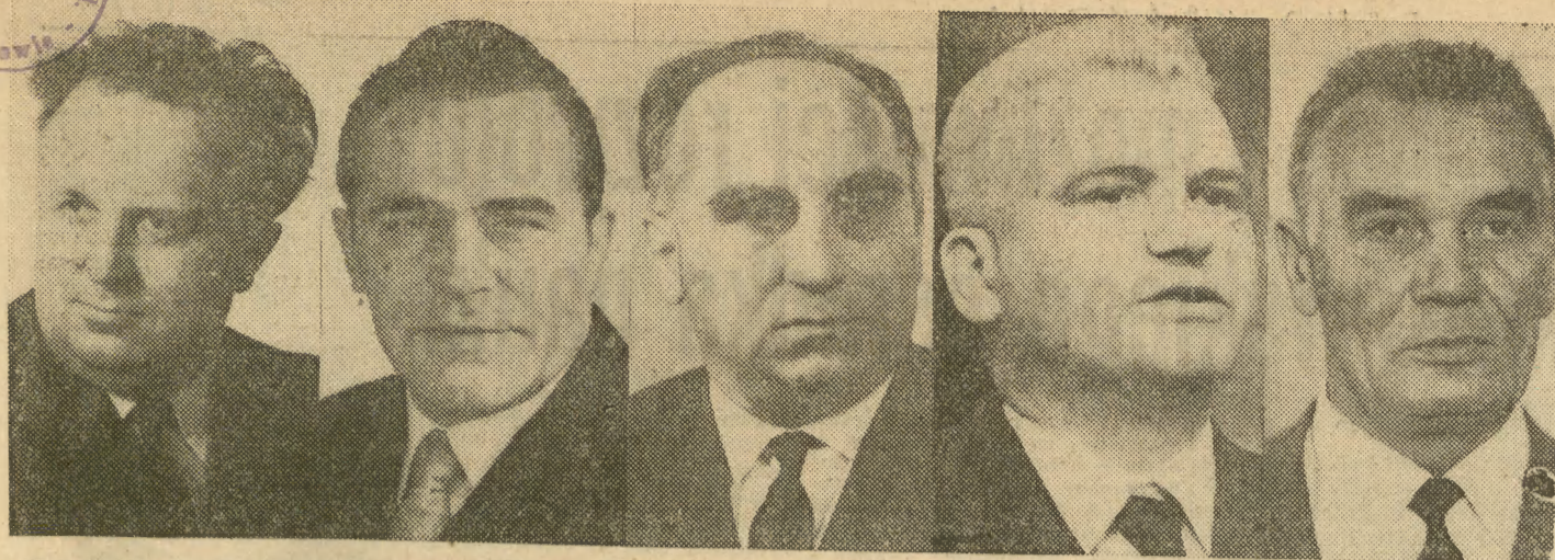
Nowo mianowani członkowie Rady Ministrów Polskiej Rzeczypospolitej Ludowej. Od lewej: STEFAN OLSZOWSKI — minister spraw zagranicznych, WIESŁAW OCIEPKA — minister spraw wewnętrznych, STEFAN JĘDRYCHOWSKI — minister finansów, ALOJZY KARKOSZKA — minister budownictwa i przemysłu materiałów budowlanych, STANISŁAW WRONSKI — minister kultury i sztuki.