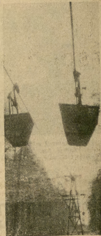
„Sienawa” w woj. zielonogórskim jest jedną z trzech istniejących w Polsce podziemnych kopalni węgla brunatnego. Eksploatowana od prawie dwudziestu lat, daje rocznie 165 tys. ton węgla. Na zdjęciu: kolejka linowa kopalni „Sienawa”.

Nastąpią też ułatwienia celne dla obywateli PRL i NRD podróżujących między tymi państwami. Dotyczą one zwolnienia od cła przedmiotów, których rodzaj i ilość wskazuje na ich przeznaczenie: do użytku osobistego, domowego, na pamiątki i upominki. Zniesione zostają deklaracje celno-dewizowe,