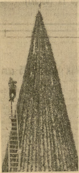
Gigantyczna dekoracja w kształcie choinki góruje nad centrum handlowym w Omaha (stan Nebraska — USA).

W Mińsku wyprodukowany został prototyp aparatu, przy pomocy którego można przekazywać na odległość kopie dokumentów, rysunki i szkice techniczne. Wystarczy aparat ten włączyć do sieci telefonicznej, aby odbiorca, znajdujący się w dużej odległości, mógł odczytać na analogicznej — zainstalowanej u siebie — maszynie kopie nadanych dokumentów.