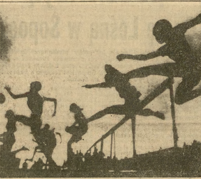
Nie jest to wbrew pozorom scena baletowa, lecz trening plotkarzy o wschodzie słońca, podczas lekkoatletycznych zawodów juniorów w Colorado (USA).

PARYŻ W poniedziałek w zachodniej części masywu Mont Blanc znaleziono zwłoki 4 alpinistów, prawdopodobnie obywateli CSRS.