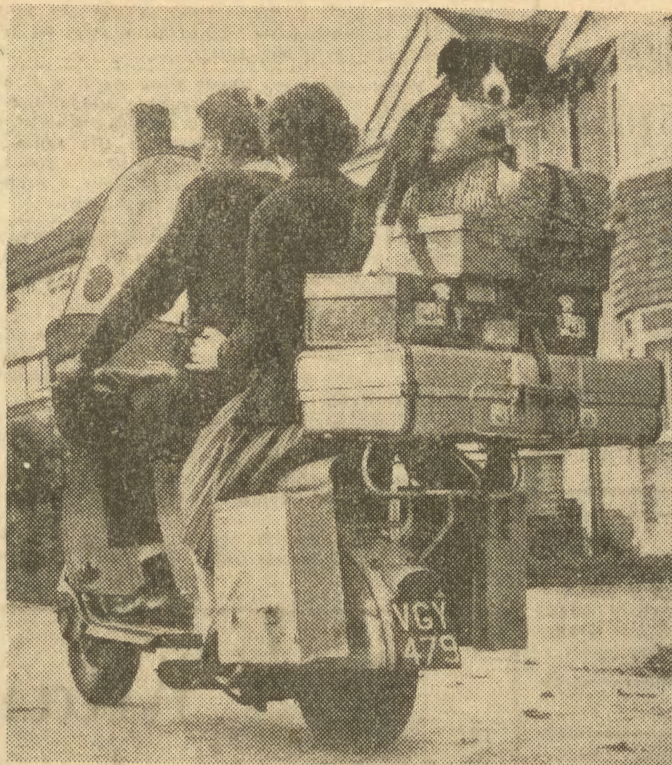
Niektóre psy pasjami lubią podróżować.