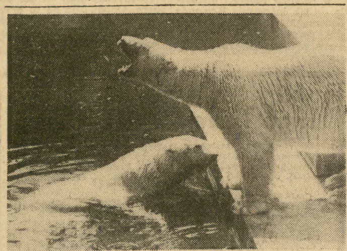
Nareszcie poczuli się trochę lepiej.

Po długim okresie upałów, wczoraj rano przeszła nad naszym województwem gwałtowna burza. Pociągnęła ona za sobą śmierć jednej osoby i wyrządziła znaczne szkody materialne.