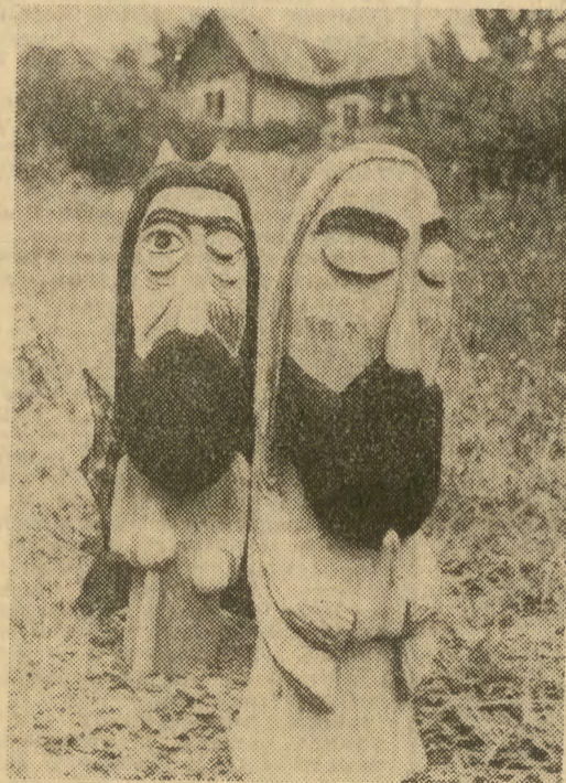
Okazałe „biesy” strzegą wejścia do drewnianego domu.