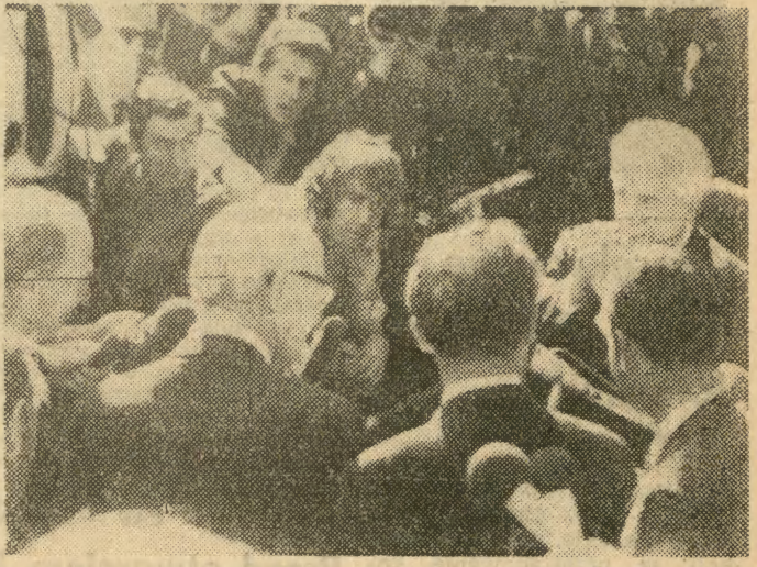
Ambasadorzy czterech mocarstw prowadzący rozmowy w sprawie Berlina Zachodniego po końcowym posiedzeniu udzielają wywiadów dziennikarzom.