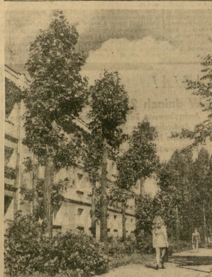
Nowa Huta to nie tylko stal i kominy — to także dzielnica zieleni, słońca i pięknych, szerokich ulic. Na zdjęciu fragment ulicy Demakowa, bez wątpienia jednej z najpiękniejszych i najbardziej zielonych ulic w całym naszym mieście.

Tymczasem Niemcy także nie rezygnują z dalszego udoskonalenia wynalazzonego przez siebie silnika. W najnowszym modelu NSU-Ro 80 zastosowano nową technologię produkcji silnika, dzięki czemu wzrosła jego trwałość. NSU z udoskonalonym silnikiem ma szybkość maksymalną przekraczającą 180 km/godz.