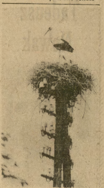
W koegzystencji z cywilizacją.