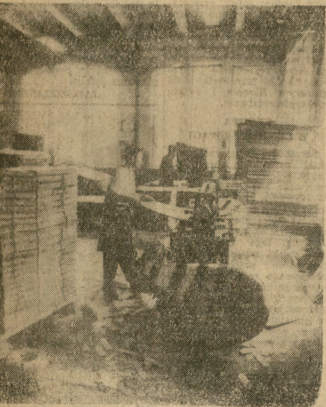
A oto końcowy etap procesu — cłete tektury na arkusze (do art. powyżej).

Rokrocznie Francuzi zakupują w księgarniach książki za ok. 3 mld franków. W 1969 r. produkcja wydawnicza francuskich oficyn wyniosła 252 mln tomów i 19.834 tytuły. Dane te ogłosił syndykat wydawców.