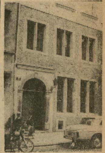
Stara kamieniczka przy ul. Mikołajskiej w Krakowie — pięknie i stylowo odnowiona. Jest to niezaprzeczalnie jedna z piękniejszych kamieniczek starego Krakowa.