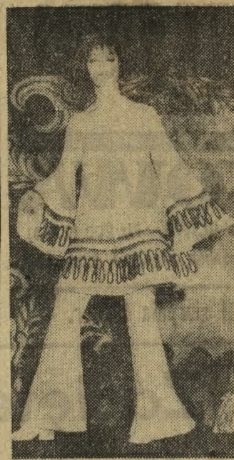
JAPONSKA DZIANINA Dzianina staje się coraz bardziej popularna. Lansuje ją również japoński projektant mody Sunako Hata. N/z: japońska wersja spodni z tuniką. Całość w kolorze zielonym; wzorzysty pas biało-czarno-zielony.

W pow. bocheńskim — PZU dokonując likwidacji 17.195 zgłoszonych szkód, wypłacił ponad 20 mln zł odszkodowań.