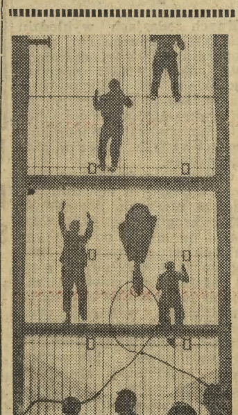
Jak już donosiliśmy, w Żydowie (woj. koszaliński) przekazany został 1,5 km kanał elektryczny przepompowoszczytowej, do którego wpłynęła już woda. N/z: przygotowania do otwarcia śluzy kanału.