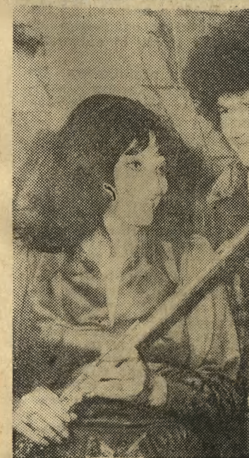
Zwycięzcy Festiwalu w konkursie międzynarodowym: I miejsce Kanadyjczyk — Robert Charlebois i II miejsce Jugosłowianka — Tereza Kesovija.