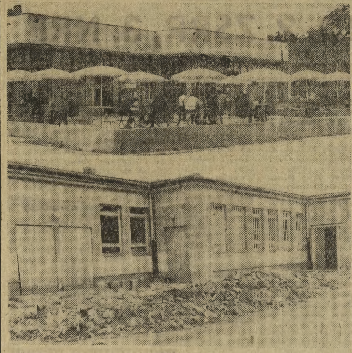
Oto dwa oblicza baru „Domino” przy ul. Sadowej. Interesująco wygląda zwłaszcza... strona zaplecza. Solidna młotła jest tu potrzebna i to natychmiast!

Za szybką realizację naszego apelu, w imieniu rencistów i własnym serdecznie dziękujemy Krakowskiemu Zakładom Szklarskim P. T. (mar)