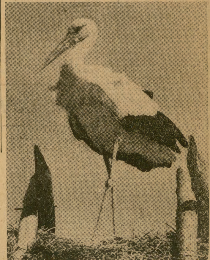
Jutro pierwszy dzień wiosny!

Jutro pogoda w rejonie Krakowa kształtować się będzie pod wpływem niżu. Zachmurzenie duże, lub umiarkowane. Wiatry południowo-zachodnie o prędkości 3-6 m/s. Temperatura dniem od plus 6 do plus 11 st. C.