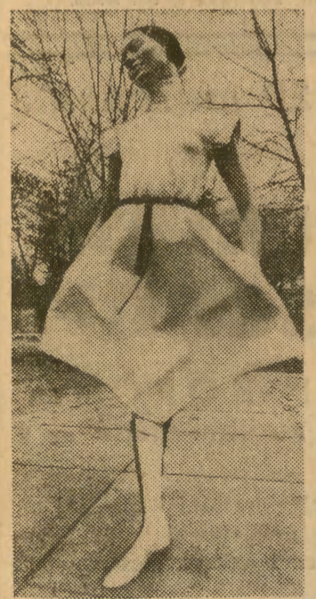
Jedną z atrakcji paryskiej kolekcji Pierre Cardin była sukienka z białej wełny o poszerzonych ramionach, z wysoką, na szyję przechodzącą stójką i asymetrycznym dołem. Dodatki: czarny skórzany pasek i czapeczka oraz dwukolorowe botki.