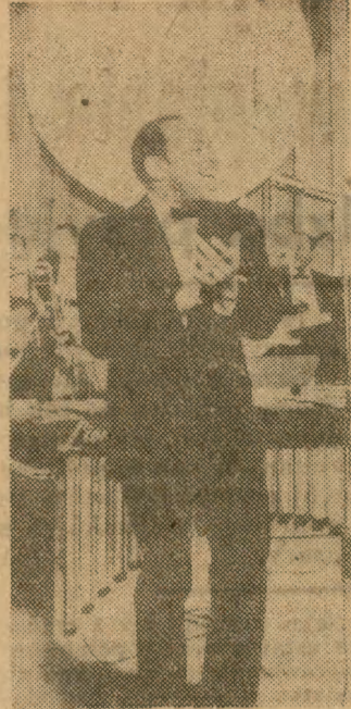
Amerikanin Lionel Hampton zaliczany jest do znakomitości świata jazzu i wymieniany przez krytyków wśród takich gwiazd jak Garper, Jackson, Ellington i Armstrong. Jest on perkusista, pianista, kompozytorem, ale przede wszystkim czołowym wibrafonistą. Wystąpi ze swym zespołem w Sali Kongresowej w Warszawie 24 marca br.

Podobne, spotkania, odbędą delegaci Starego Miasta i Zwierzynicy. Delegaci Starego Miasta przygotowują się do przedyskutowania dalszego rozwoju licznych tutaj placówek naukowych i kulturalnych, zagadnień młodzieży, dalszego rozwoju partii w środowiskach robotniczych, naukowych, kulturalnych, młodzieżowych. Zwierzynicy koncentruje uwagę także na środowiskach naukowych i młodzieżowych. Szczególnie cenne jest to, że powstają tu konkretne koncepcje większego niż dotąd świadczenia usług na rzecz przemysłu (AGH), rolnictwa (WSR), podnoszenia oświaty (WSP) całego naszego regionu. (bp)