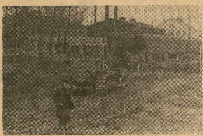
W rejonie Dworca Głównego czynione są przygotowania do planowanej modernizacji ruchu kolejowego — pierwszym etapem prac jest budowa nowej jezdni, która połączy plac dworcowy z ulicą Pawia.

oparta jest na tekstach Kopernika, Giordano Bruno, Leonarda da Vinci, Gagarina i Glenna, zawierających uwagi o świecie, Ziemi i Kosmosie. Opiewa ona, niby hymn, wyjęcie człowieka we wszechświat. Teksty te śpiewa lub recytuje chór oraz soliści. Nad przygotowaniem wykonania tego dzieła pracujemy bardzo intensywnie. Wykorzystujemy też okresowy pobyt autora, Krzysztofa Pendereckiego, w Krynicy: jeździłem do niego na rozmowy w sprawie pewnych korekt muzycznego tekstu, uwag interpretacyjnych itp. — A po wykonaniu „Kosmogonii” Filharmonia Krakowska znów rusza w świat? — Już 23 kwietnia wyjeżdżamy na parotygodniowe tournée po Włoszech, gdzie naszą orkiestrą filharmoniczną dyrygować będzie włoski kamelmistrz