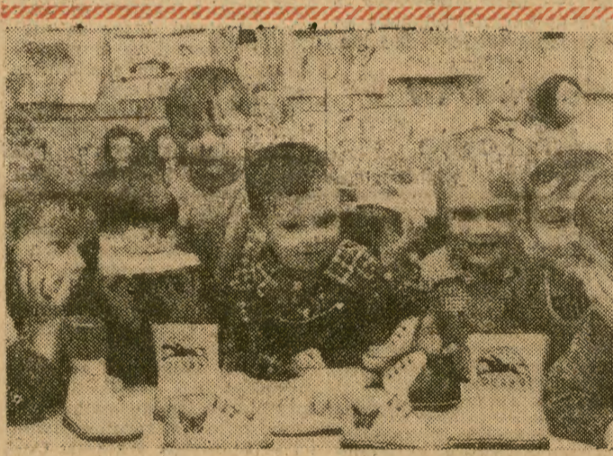
CAF — Wawrzynkiewicz

W INDOCHINACH, sily wyzwoleńcze w dalszym ciągu znajdują się w ofensywie.