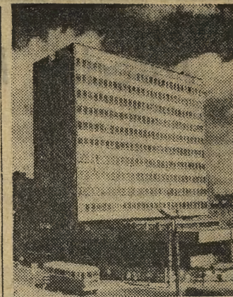
Lublin otrzymał nowy hotel „Victoria” usytuowany przy ul. Narutowicza, której architektura należy do najstarszych w Lublinie. Nowoczesna sylwetka hotelu ozdobi i uatrakcyjni starą ulicę. Budynek wzniesiony został z lekkich konstrukcji aluminiowych, jego ściany zapewniają izolację cieplną i dźwiękową. Tęgo rodzaju rozwiązanie zastosowano w Lublinie po raz pierwszy. Na dwunastym kondygnacji mieścić się będzie bar kawowy, skąd rozciąga się wspaniały widok na okolice. Wnętrze hotelu będą zdobione grafikami lubelskich artystów. Hotel przygotowany jest na 270 łóżek. Ilość ta w znacznym stopniu poprawi sytuację „Polaka w delegacji”. Wprawdzie stosunkowo niedawno oddano tu do użytku ładnie usytuowany i przytulny hotel, ale w okresach wzmożonego ruchu turystycznego, zjazdów i konferencji, brak miejsc odczuwano tu również boleśnie, jak i w innych miastach. Na zdjęciu: hotel „Victoria” w Lublinie.