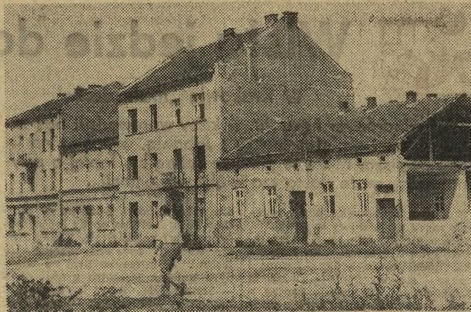
Już niedługo tylko fotografia będzie świadczyła o tym, że przy ulicy Bąskiej 46 — 52 stały kiedyś uwiecznione na naszym zdjęciu budynki. W związku z pracami przy budowie mostu Grunwaldzkiego zostaną one wkrótce całkowicie wyburzone, a na ich miejscu powstaną nowoczesne rozjazdy.

* Stary Teatr wznawia po przerwie cieszącą się dużym powodzeniem komedię E. Maneta „Mniszki”. Pierwszy spektakl odbędzie się w niedzielę, 18 bm. o godz. 15 na scenie Teatru Kameralnego w premierowej obsadzie.