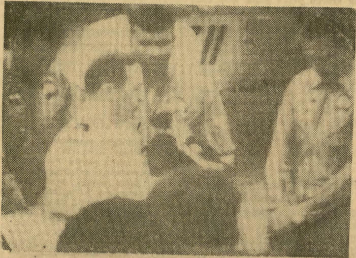
Po pomyślnym wodowaniu „Apollo-13” na Pacyfiku, 17 bm astronauta zostali przewiezieni śmigłowcem na pokład lotniskowca „Iwo Jima”. Na zdjęciu od lewej: w szarych skafandrach J. Lovell, F. Haise i J. Swigert.