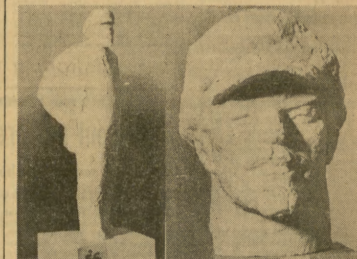
Praca W. Kućmy i A. Korpaka