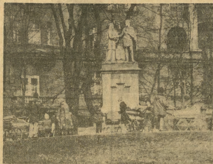
Kiedy pod pomnikiem Jagielly i Jadwigi na Plantach pojawiają się w większej liczbie dziecięce wózki — nieomylny to znak, że do naszego miasta zawitała prawdziwa wiosna.

Przypuszcza się, że oba te przestępstwa spowodowali ci sami osobnicy. Energiczne śledztwo wszczęła Komenda Miejska MO Kraków-Podgórze. (Z)