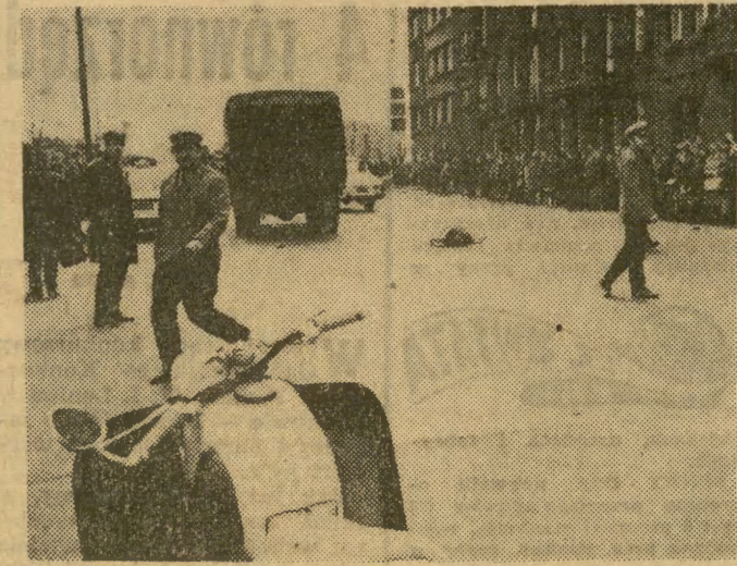
Wczoraj na al. Trzech Wieszców, przy przejściu dla pieszych w sąsiedztwie ulicy Morawskiego, samochód ciężarowy nr rej. KS 84-85 należący do „Chemobudowy” (Zachłoc 54) najechał na przechodnia. Wypadek zakończył się śmiercią.

W tym roku na torze na Służewcu, a latem także w Sopocie i Wrocławiu w gonitwach na długość od tysiąca do ok. 3 tys. metrów startować będzie 600 koni, czyli więcej niż w latach poprzednich. Przyjęto zasadę, że w każdej gonitwie, z wyjątkiem selekcyjnych, powinno startować nie mniej niż 6—7 koni, w gonitwach selekcyjnych zaś co najmniej 4 konie.