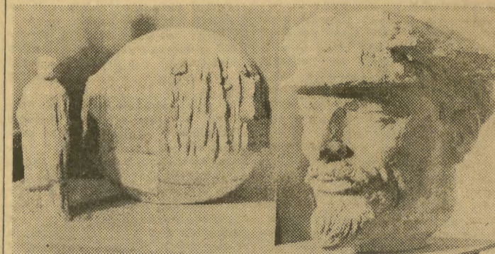
Praca J. Sieka