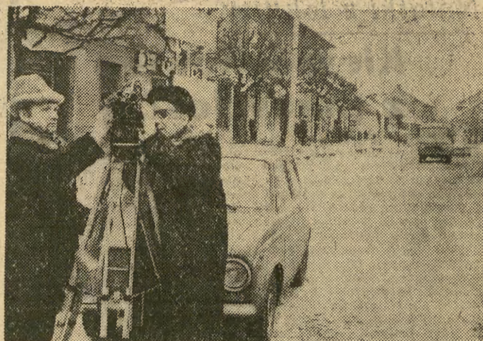
Krakowska TV już teraz przygotowuje program na Dzień Kobiet. Oto, „przyłapani na gorącym uczynku”. Koledzy, kręcący w Kętach film do reportażu pt. „Charaktery”.