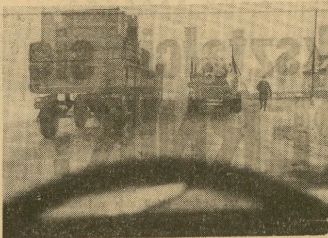
Niedobrze, obywatelu kierowco z wadowickiej PKS. Droga Wadowice — Andrychów ruchliwa, a panu się zdaje, że dosiada ręcznego rumaka wysięgowego. Tymczasem siedzi pan na ciężkim koniu roboczym. Na takim „koniu” nie wolno wyprzedzać innego ciężkiego konia — tym bardziej, że obaj mają na grzbiecie dobrych parę ton ładunku. Było to dnia 18 bm. około godz. 10. Samochód miał numer rej. KF 0474.