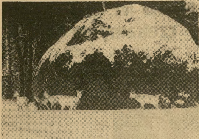
W pobliżu Państwowej Stadniny Koni w Janowie Podlaskim, zadowolony się stadko białych danieli. Pracownicy Stadniny dbają o nie, jak o swoje, słynne na całym świecie, araby. Danieli w Polsce