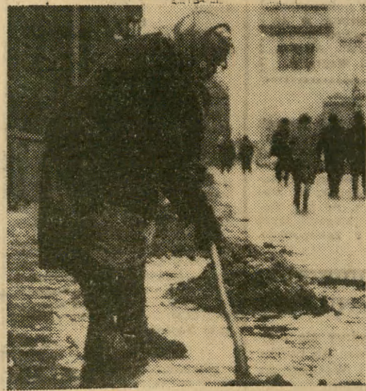
Duży opad śniegu, silny mroź, odwilż, deszcz, błoto, i znów duży opad, silny mroź, odwilż... tak bez końca ćwiczy nas tegoroczna zima. A każda zmiana pogody to nowa okazja do sprzątania ulic. Oj napracują się dozorczy (ci porządnicy), napracują. Nic więc dziwnego, że każdy wzdycha do wiosny.

W dniu 23. II. br. o godz. 19.15 w sali Teatru „Kameralnego” grana będzie po raz ostatni „Godzina Poezji” w wykonaniu popularnych aktorów scen krakowskich. Bilety do nabycia w Orbisie oraz w kasie Teatru.