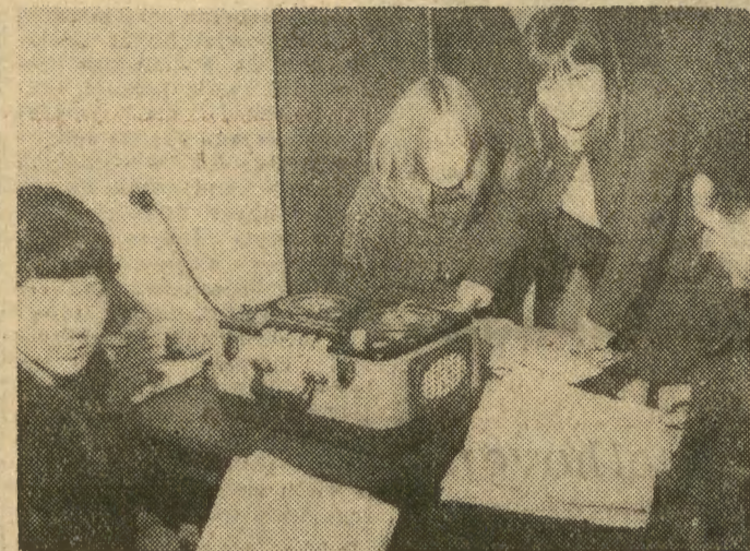
Materiały konkursu „Ocalmy od zapomnienia” są szczegółowo studiowane przez zespół pracowników naukowych Muzeum Etnograficznego w Krakowie.

RZYM Włoski Komitet d/s Obchodów Setnej Rocznicy Urodzin Lenina podjął decyzję budowy pomnika wielkiego przywódcy Rewolucji Październikowej. Pomnik odsłonięty będzie jeszcze w br. na wyspie Capri. Uroczystość ta połączona zostanie z wielką manifestacją ku czci Lenina.