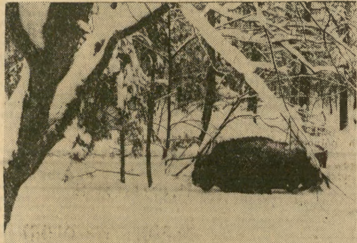
Śniegu tyle, że nawet król puszcy — żubr, porusza się w nim z największą trudnością. Dla zwierząt drobniejszych — to po prostu śmierć.

Naukowcy pracujący w Instytucie Badawczym tych Zakładów zgłosili także projekt skonstruowania, na powyższych zasadach, magazynów, których gumowa powłoka mogłaby być napełniona powietrzem w ciągu 20 minut. Ustawienie jednak wspierającego kopułę dachu olbrzymiego rusztowania trwa około trzech dni. W próbnym modelu takiego magazynu pomieściło się 60 wagonów materiałów budowlanych. MB