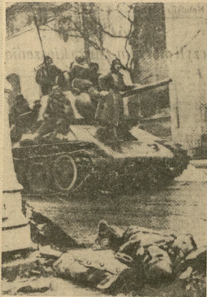
Czołgi radzieckie na ul. Franciszkańskiej — I. 1945 r. — Kraków.