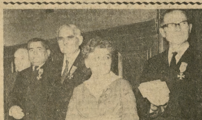
Wśród uroczystości 25-lecia wyzwolenia Krakowa spod jarzma hitlerowskiego ważną pozycję zajmuje dekoracja wysokińi odznaczeniami państwowymi osób wybitnie zasłużonych, której dokonano wczoraj w Prezydium RN m. Krakowa.

Srodowisko krakowskie — dzięki akcjom w rodzaju „Limanowa” czy „Dąbrowa Tarnowska” wypracowało oryginalny profil działania kół naukowych, polegający na łączeniu teorii z praktyką, przy jednoczesnym akcie niesienia doraźnej pomocy zaniedbanym powiatom. Coraz częściej dyplomanci podejmują się pisania prac magisterskich z zakresu tematów, zaproponowanych przez władze owych powiatów. (zs)