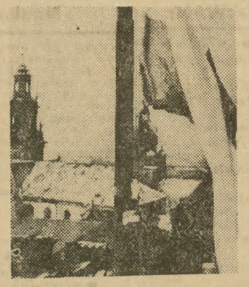
Polska flaga na Wawelu (18. I. 1945 r.).

Odbiór programu telewizyjnego jest możliwy — jak wiadomo — jedynie w bezpośrednim zasięgu fal nadawanych z wieży telewizyjnej. Dlatego wysokość tych wież jest coraz większa. Przez pewien czas prymat na tym odcinku należał do Związku Radzieckiego. Wieża telewizyjna w Moskwie ze swoją wysokością 583 metry była „rekordzistką świata”. Następnie wzniesiono w Japonii wieżę telewizyjną o wysokości 570 metrów. Rekord ten zamierza obecnie pobić telewizja francuska. W Paryżu ma być wybudowana wieża telewizyjna o wysokości 725 metrów i wadze 9 tys. ton. Ma się ona składać z dwóch stożków złączonych u podstawy. Taką wysokość wieży ma zagwarantować odbiór telewizji i radiofonii UKF w promieniu 200 km od Paryża.