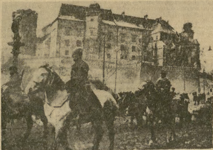
Wojska radzieckie pod Wawelem (18. I. 1945 r.).