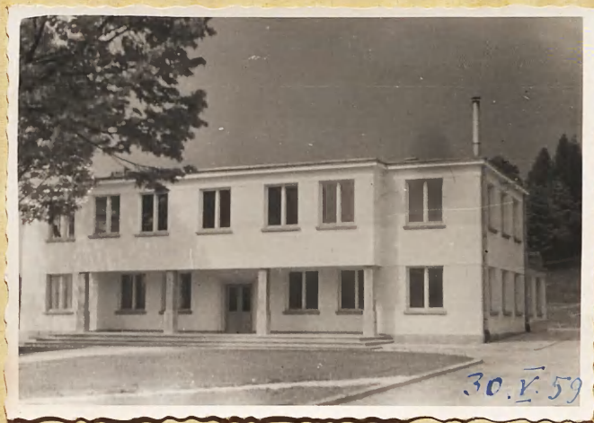
Fotografia obok to Tarienki w Wapiennem.

30 maja 59 r. było otwarcie nowoczesnych tarienek w Wapiennem - na otwarciu tarienek były osoby prosrone z bliska i z dalsza a widocznie brakto miejsca, czy papieru, by mogły podobne zaproszenia widzieć kierownicy szkół miejscowych i najbliższych, widocznie organizatorzy uważali, że nowoc. wiejskie ma poddostatkicim swierego powietrza i „atrakcji” codziennego swierego zycia, to nie