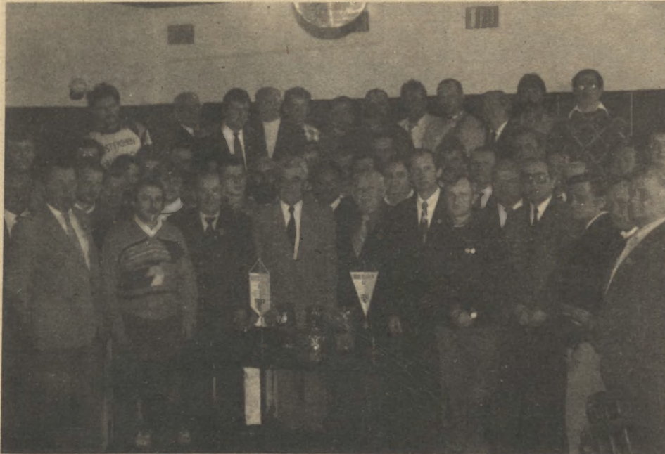
„Rodzinne zdjęcie” z okazji jubileuszu 40 lecia Kolegium Sędziów w Olkuszu.

Pod koniec ubiegłego roku zorganizowano z tej właśnie okazji uroczyste spotkanie, w czasie którego była okazja do refleksji, wspomnień i programowania jak najlepszej współczesności.